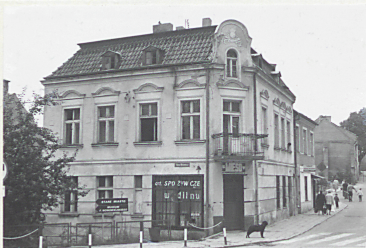
BARCZEWO, ul. Warmińska nr 1 Kamieniczka H okapu =7,2m H kalenicy =9,6m