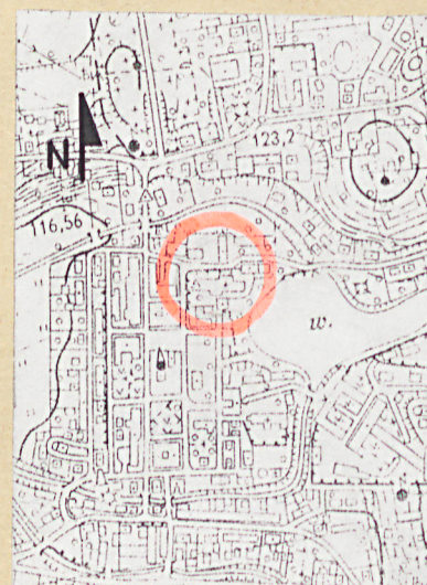
Plan orientacyjny skala 1:10000

4. Adres Parafia rzym.-kat. p.w. św. Anny w Barczewie, 11-010 Barczewo nr hipoteczny KW 15 282