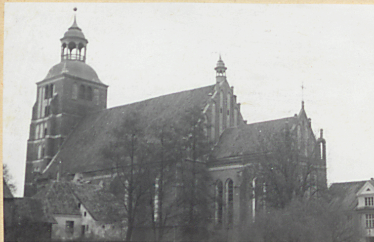
Widok kościoła od p.d.-wsch.