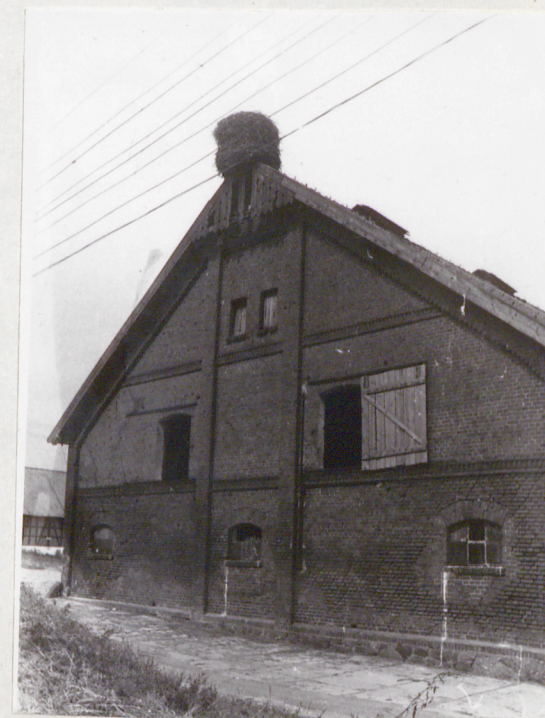
Obora, elewacja szczytowa pld.-zach.