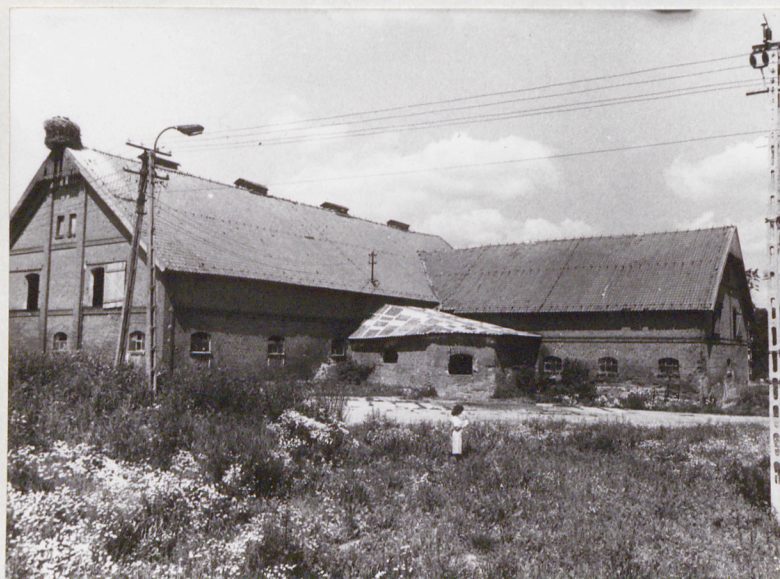
Obora, elewacja pn.-wsch./dłuższa/ i pld.-wsch. /szczytowa/ części niższej