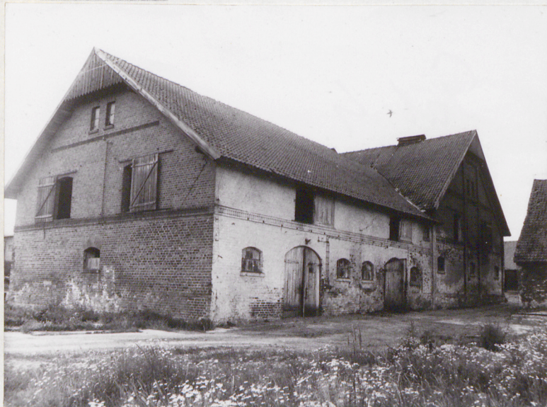
Obora, widok od południa

Instalacja: Elektryczna, zasilana z sieci.