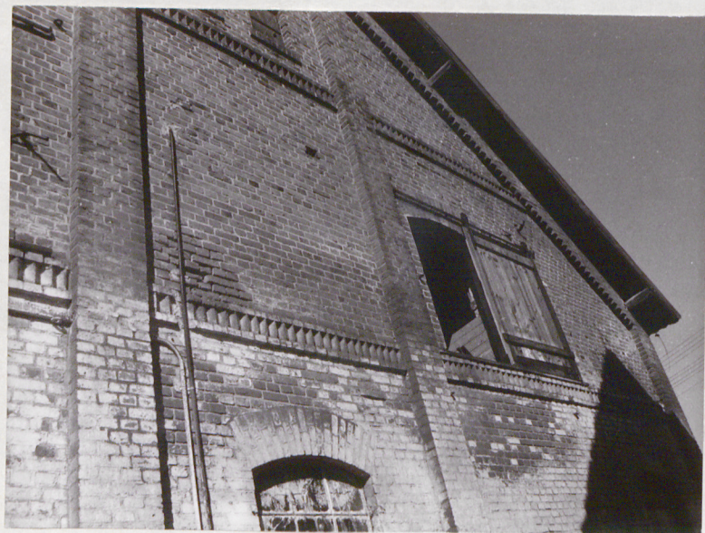
Fragment elewacji pn.-zach. z datą 1914 nad wrotami.