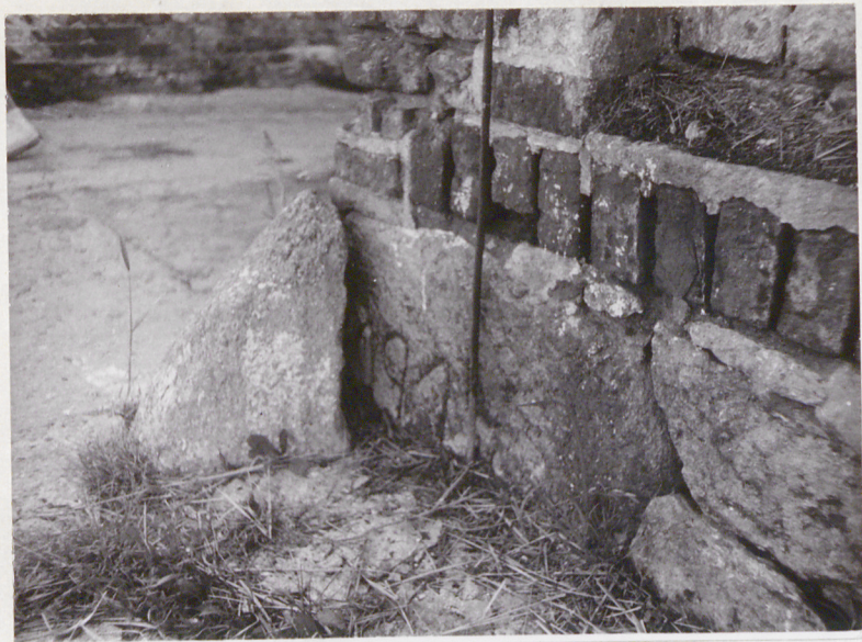
Data 1914 na kamieniu podmu- rówki części szerszej w narożniku północnym.