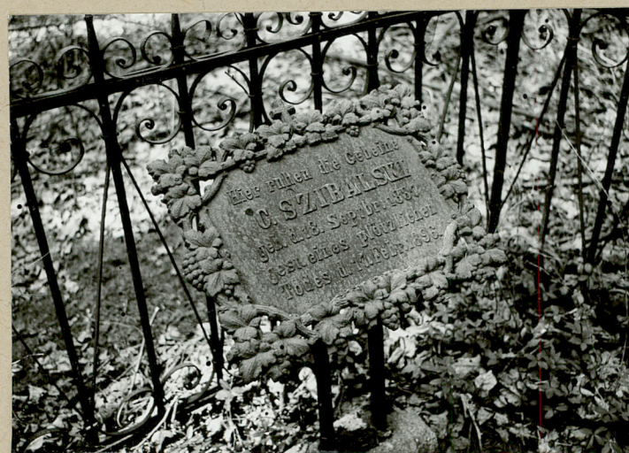
Tablica na mogile z k.XIX w.