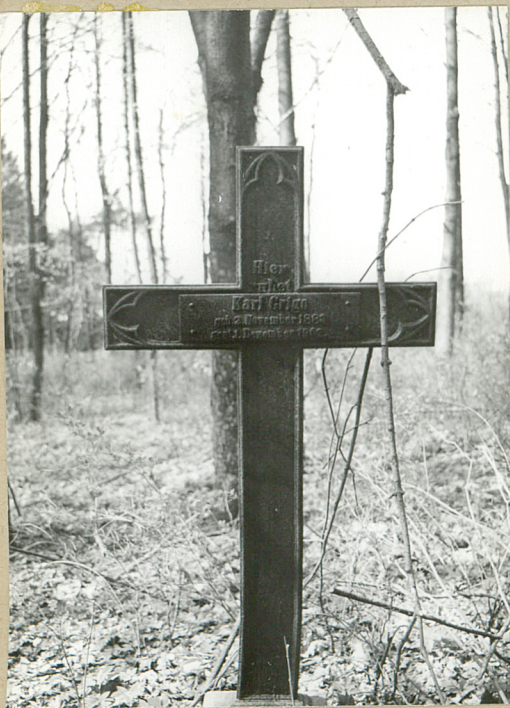
Krzyż z pocz.XX w.