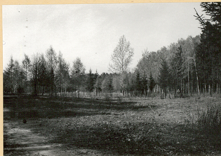
Płn. narożnik cmentarza