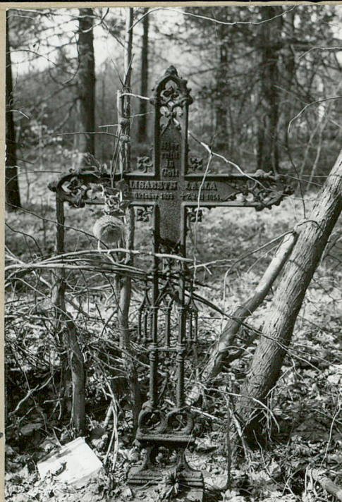
Krzyż z k.XIX w.