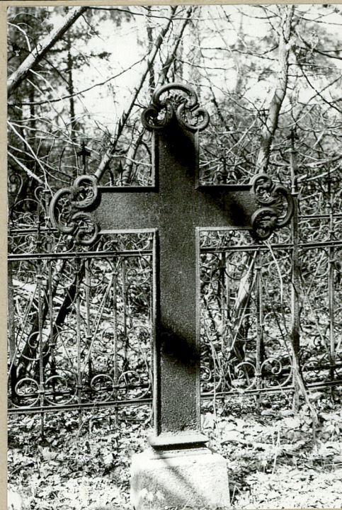
Krzyż z k.XIX w.