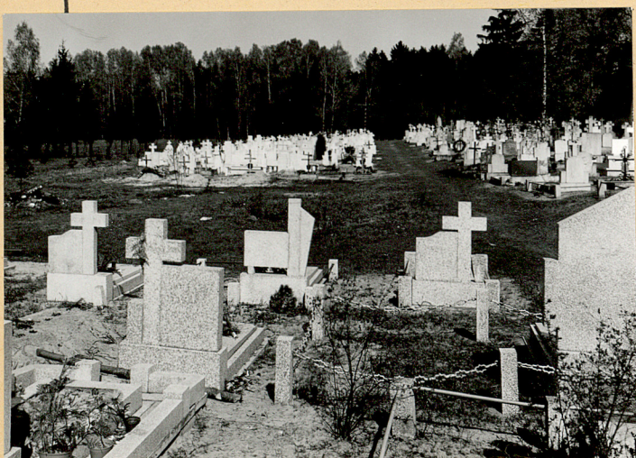
Płn.-zach. fragm. cmentarza