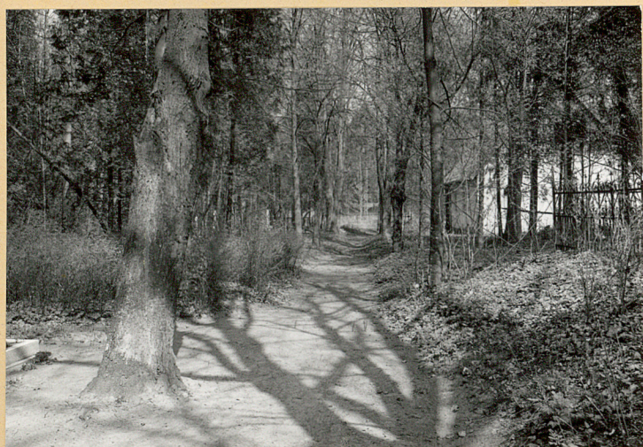
Alaja centralna/lipowa /