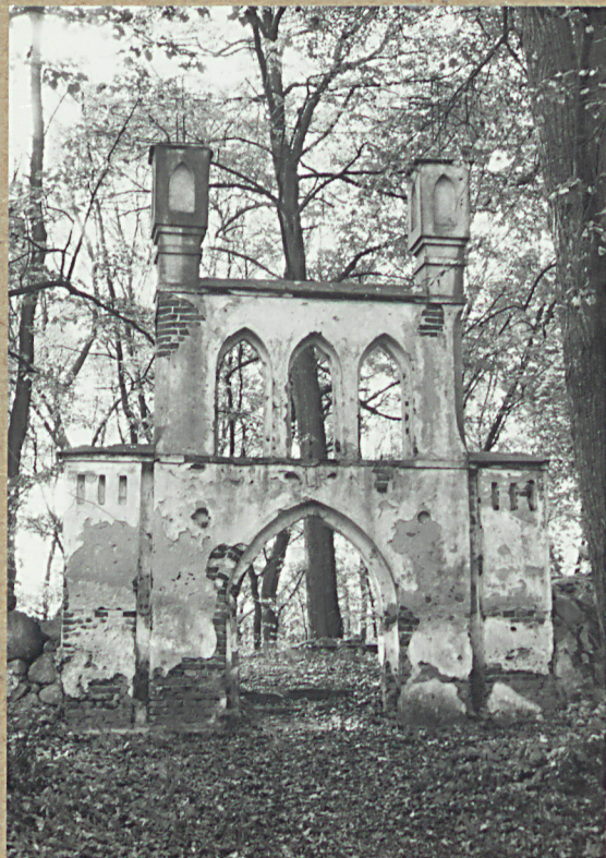
2. BRAMA CM.