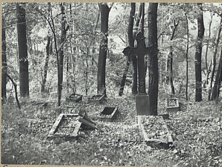
6. KRZYŻ ŻEL. - ANTONI KULLAR 1861 r.