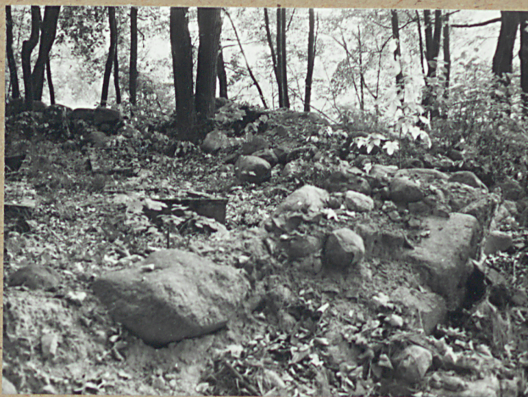
4. FRAGM. WNEŁTRZA I ZNISZCZONY MUR