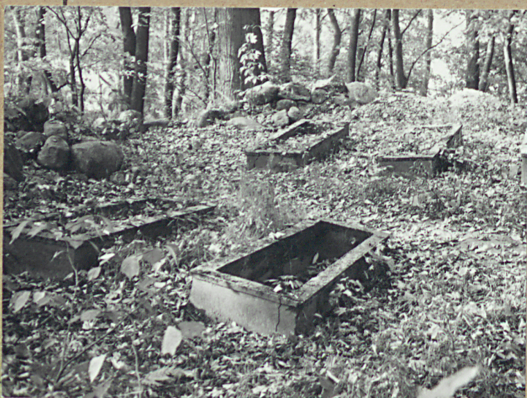
9. NAGROBKU ZA BRAMĄ CM. -