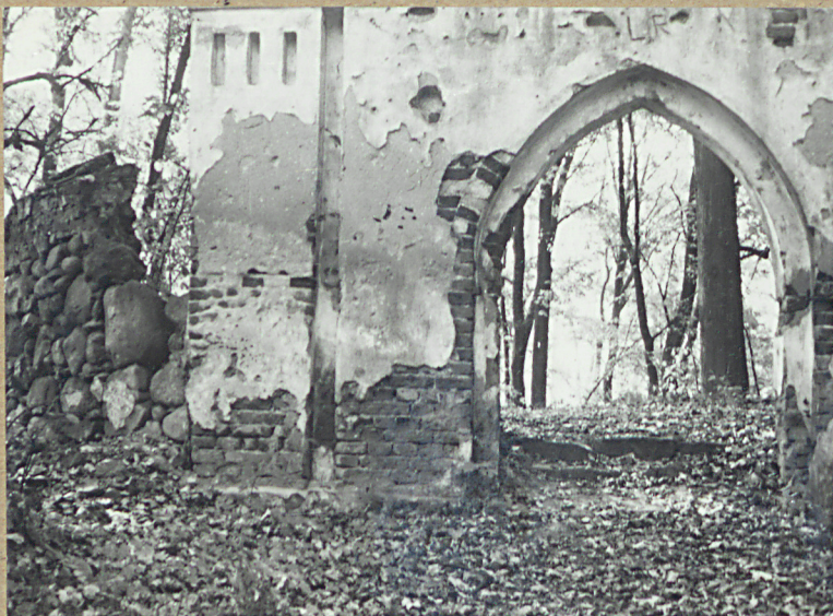
5. BRAMA I FRAGMENT MUROU CM.