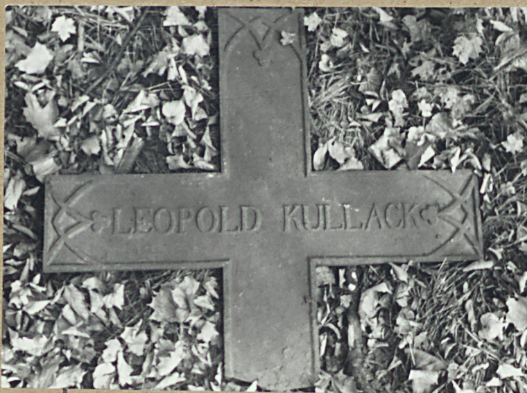
7. KRZYŻ ŻEL. ŻELANY - LEOPOLD KULLACK