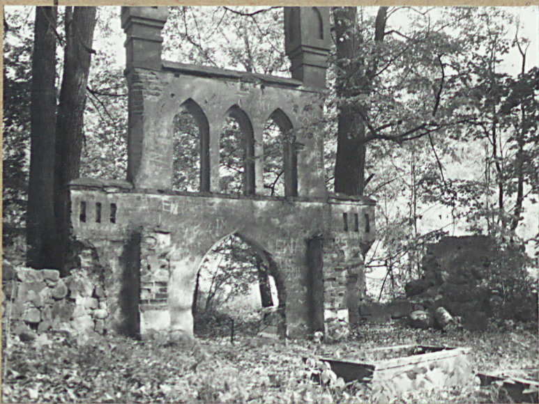
3. BRAMA I FRAGM. KAMIENNEGO MURU - OD WENNAŁTRZ