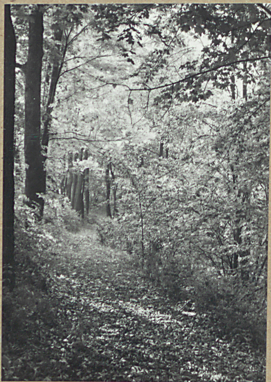
1. ALEJA PROWADZĄCA DO CM.