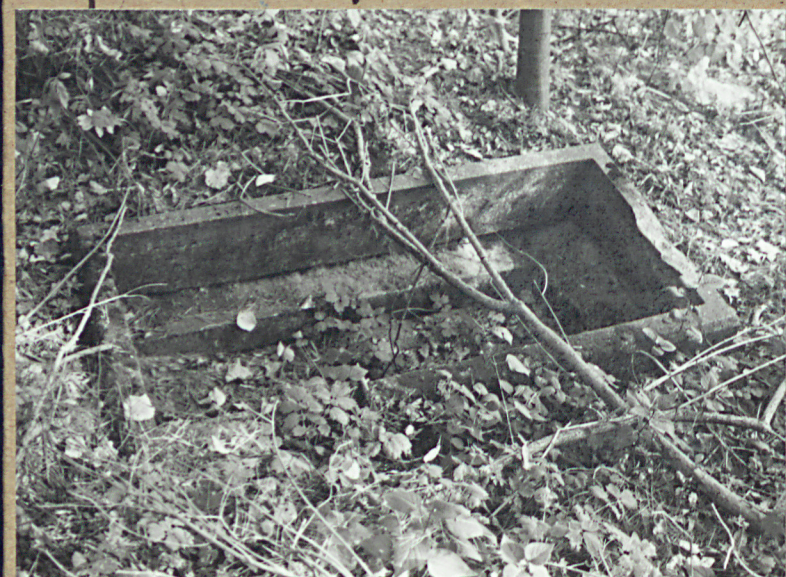
4. ZNISZCZONY NAGROBEK