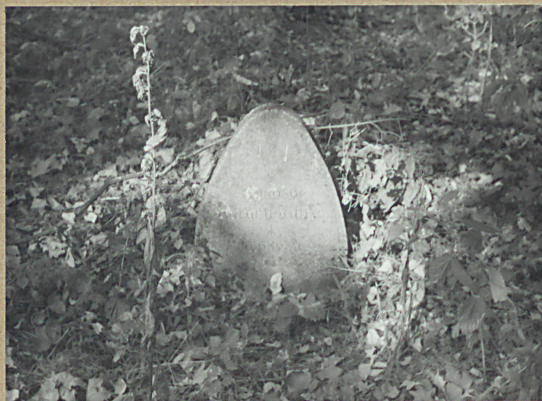
5. KUNEG. KUNZE 1939 R.