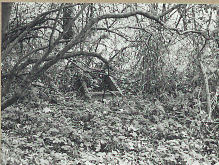
3. NAGROBEK W PN. CZĘŚCI CMENTARZA