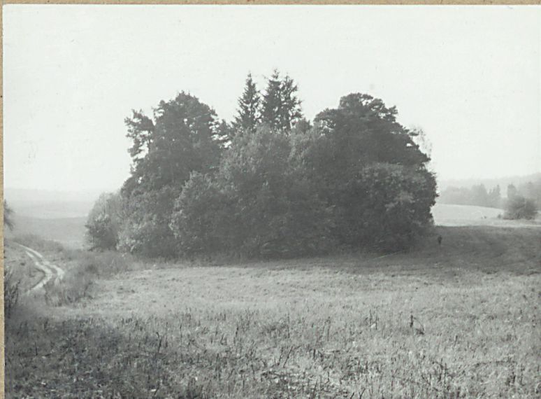
1. WIDOK OGÓLNY PŁN. STRONY CMENTARZA