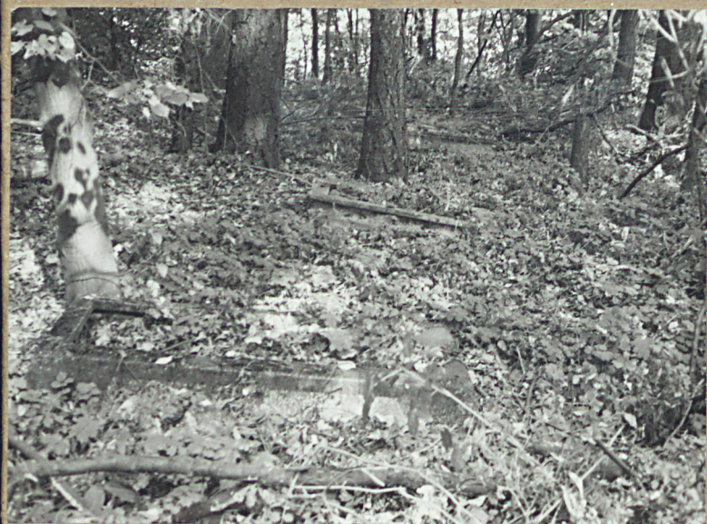
2. NAGROBIEK W ŚRODKOWEJ CZĘŚCI CMENTARZA