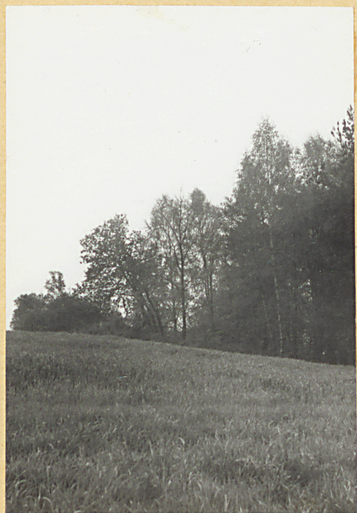
widok od płn.-zach.