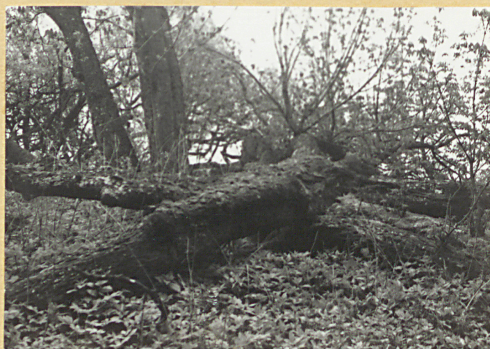
złamany kasztanowiec wielopniowy