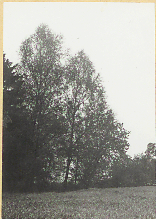
widok od pld.-wsch.