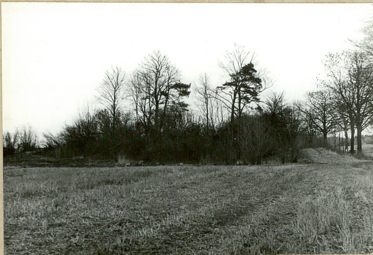
Widok ogólny z zachodu