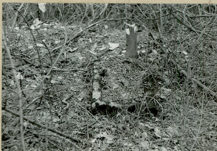
Jeden z zachow. nagrobków