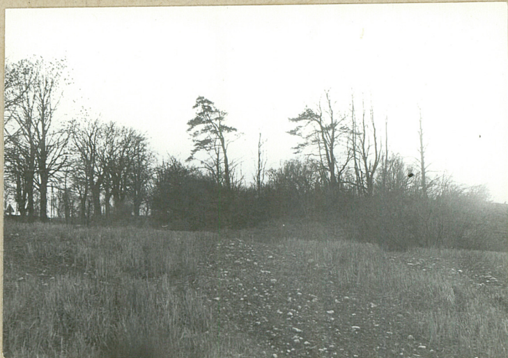
Widok ogólny z pñn.- wschodu