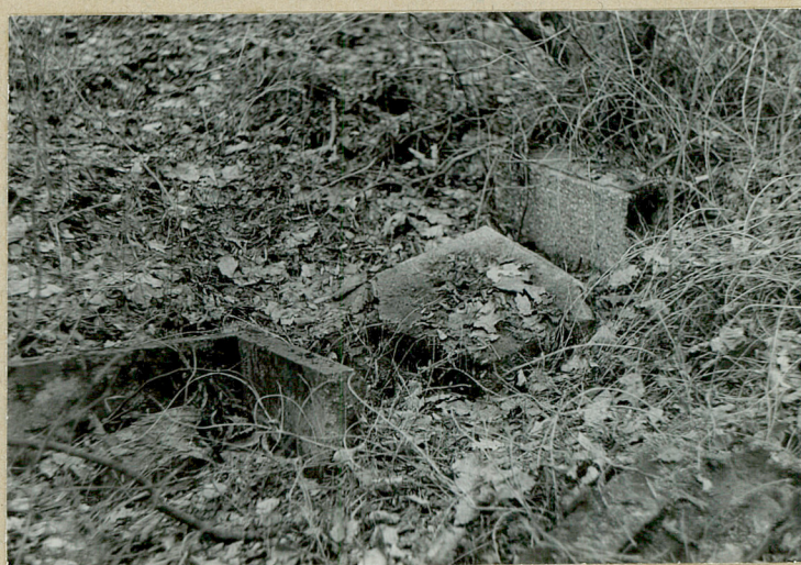
Zachowane nagrobki z I poł. XX w.