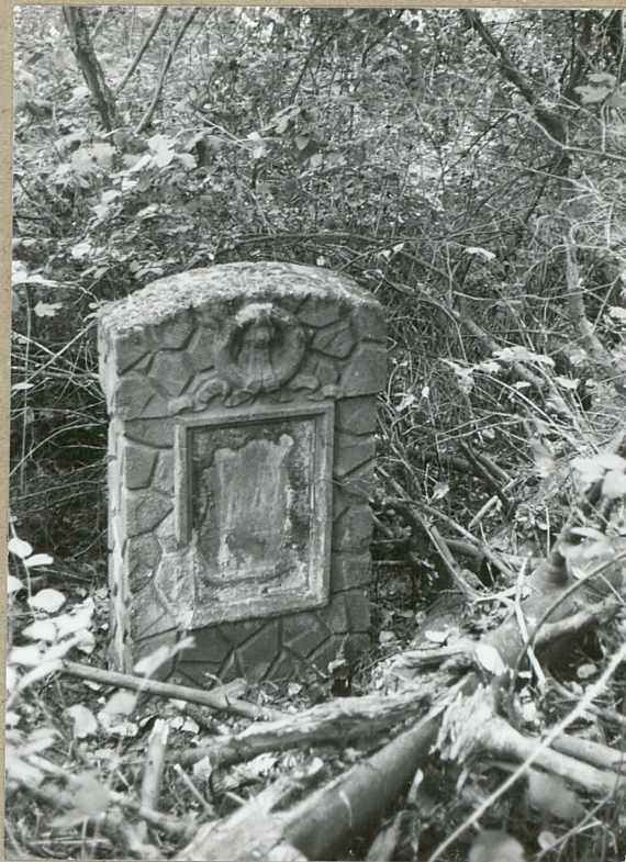
6. NAGROBEK BEZ DATY