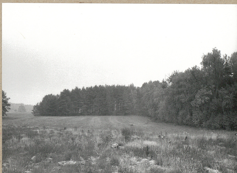
2. STRONA WSCH. CM. Z PRZYLEGAJĄCYM LASIEM