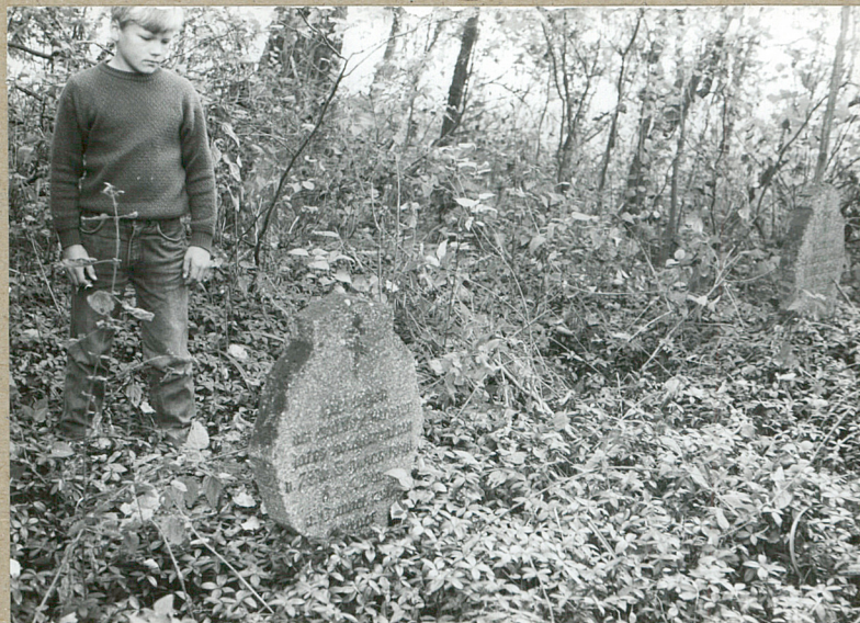
5. FRAGM. KWATERY WOJENNEJ z 1914 R.