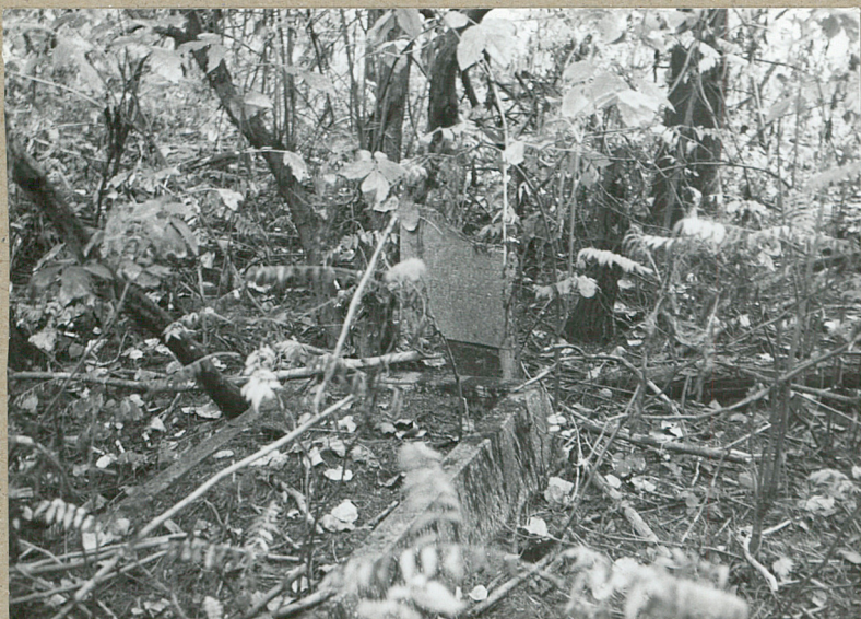
7. NAGROBEK z 1933 R.