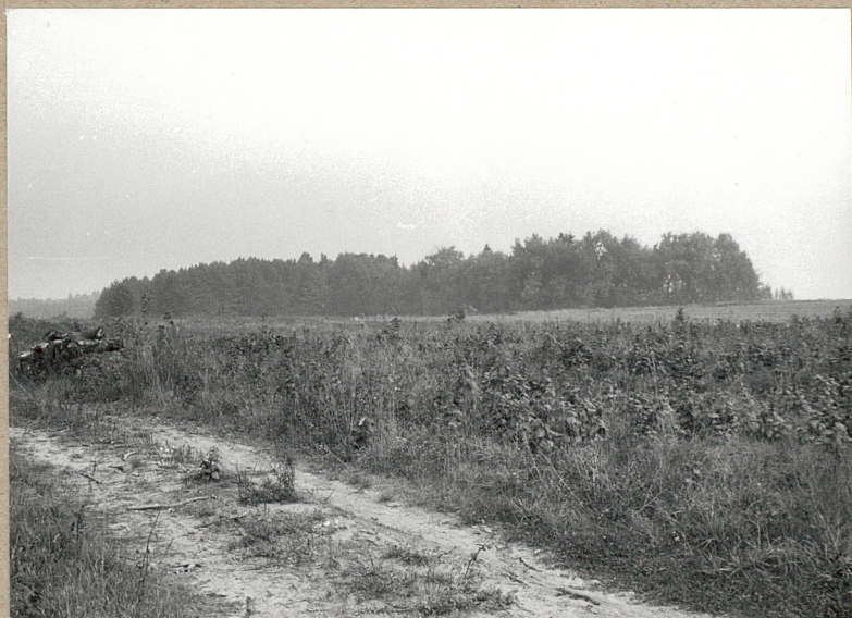
1. OGDŁNY Z DROGI ZE WSI