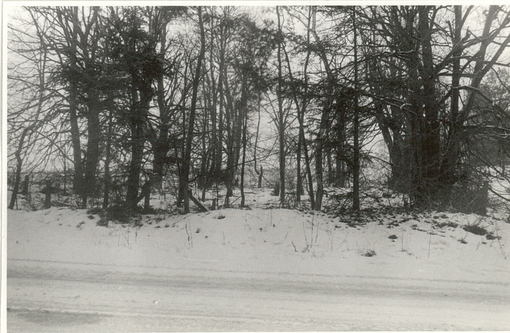
Widok od strony wejścia