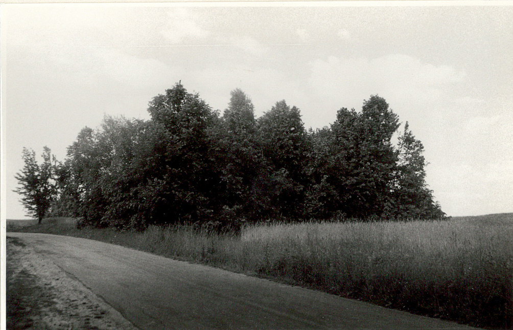
Widok ogólny od strony szosy