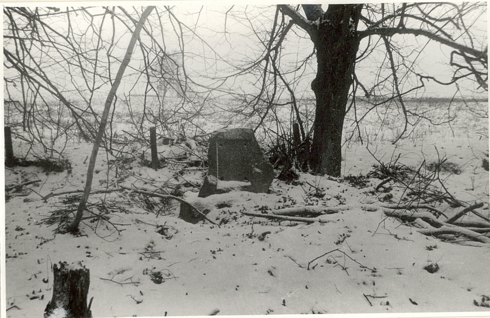
Widok ogólny cmentarza