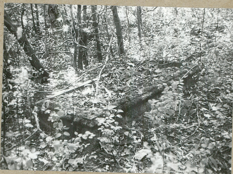
13. NAGROBIEK NN