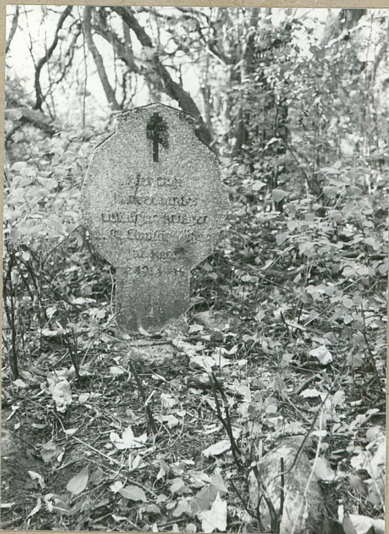
10. MOGIŁKA WOJENNA 1914-1915