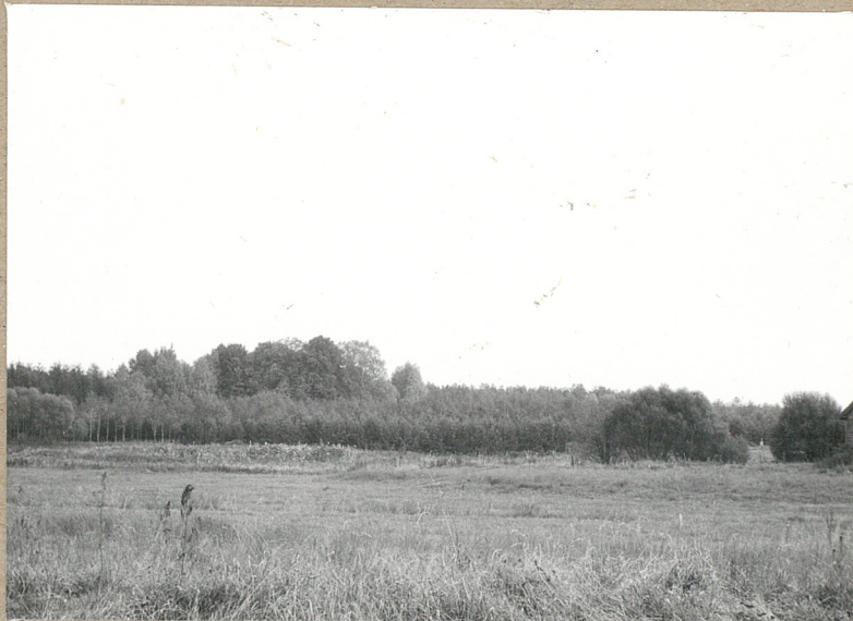
1. WIDOK NA ŁĄK W KTÓRYM CM.