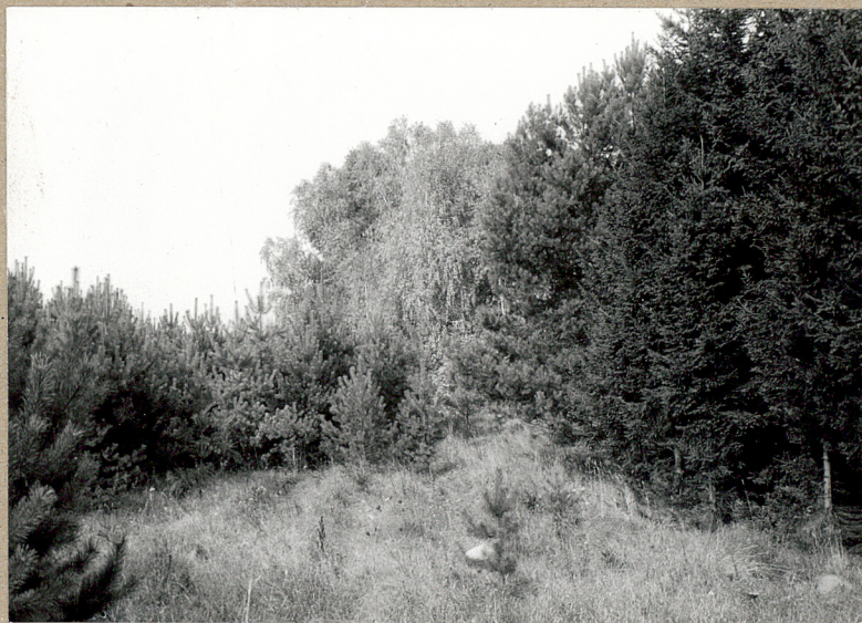
2. DOJŚCIE DO CM. OD DROGI POLNEJ