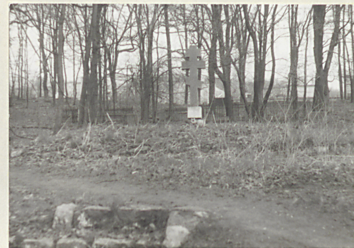
Kwaterna żołnierzy rosyjskich w pld.-zach, części cmentarza