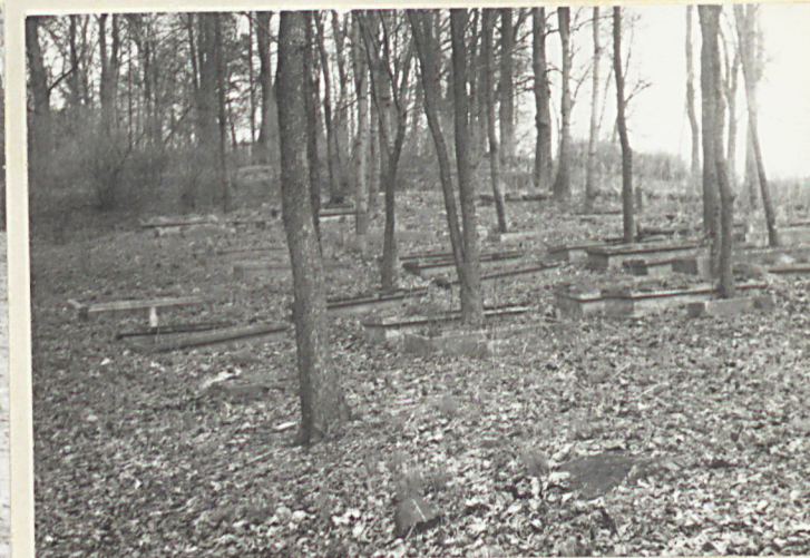
Fragment cmentarza w pld.-zach. części cmentarza