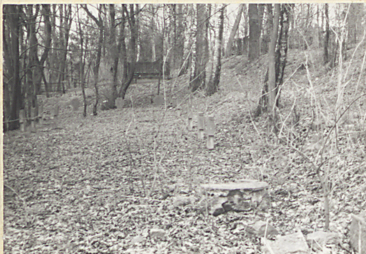
Taras górny kw.-widok od pld.