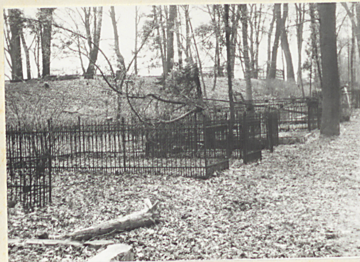
Kwatery rodz. w płn.-wsch. części