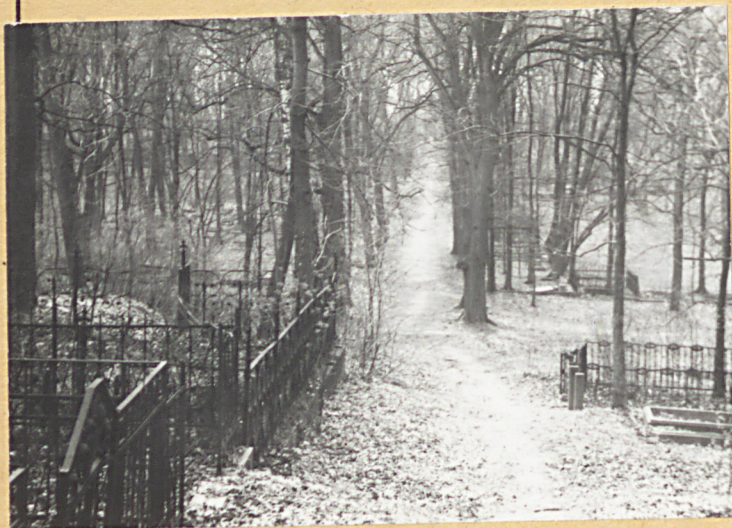
Aleja gł. - widok od północy