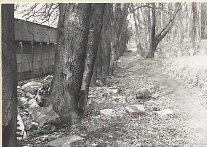
× Taras dolny kw.-widok od pld.