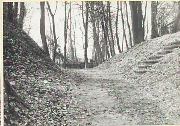
Alejka prowadząca na cmentarz z ul. Jaśkowskiej /str. płn.-wsch./