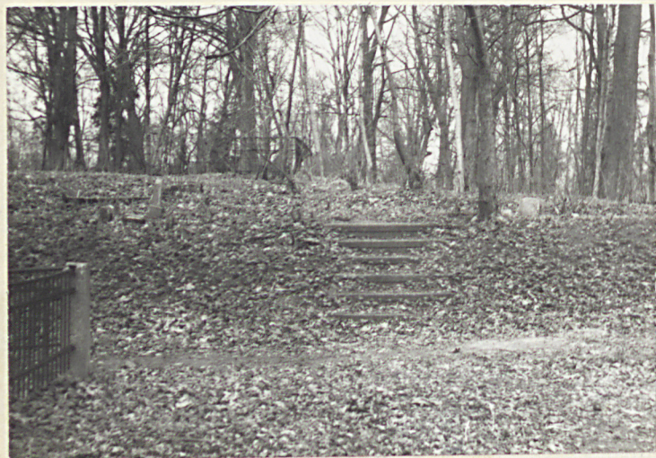
Schody wiodące na górny taras