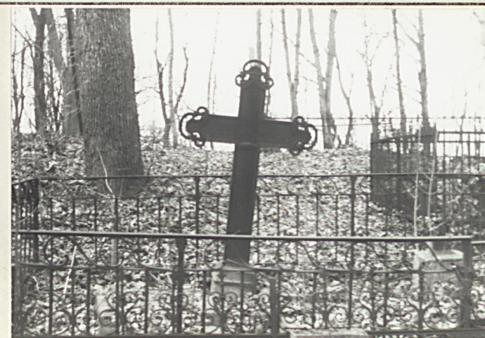
Jeden z nielicznie zachow. krzyży nagrob.