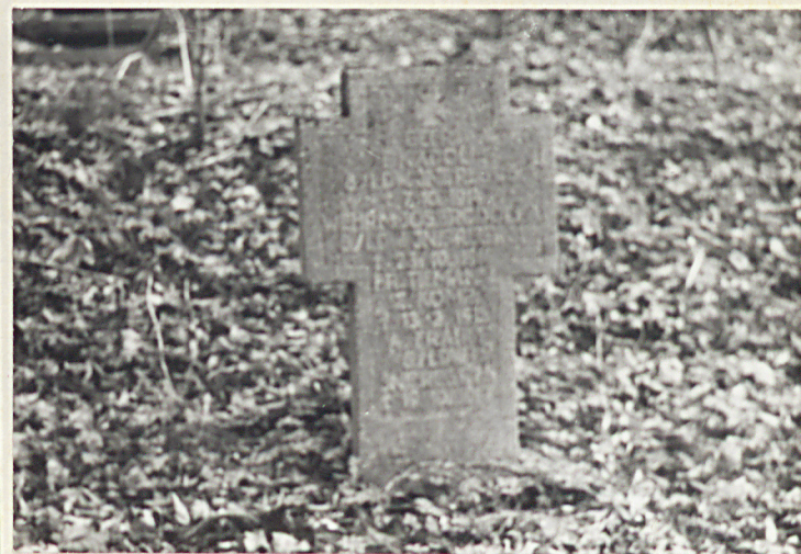
× Jeden z krzyży nagr.z napisem