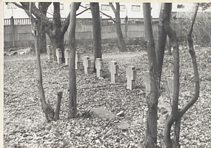
× Krzyże nagr. w pñn.części kw.