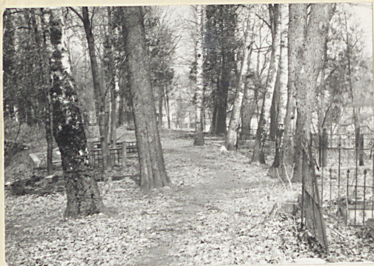
Aleja boczna w płn.-zach. części cmentarza