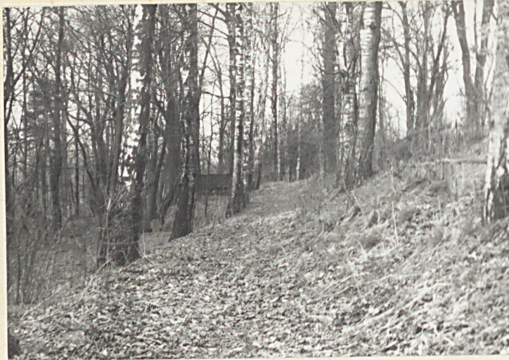
Alejka boczna w płn.-zach. części cmentarza