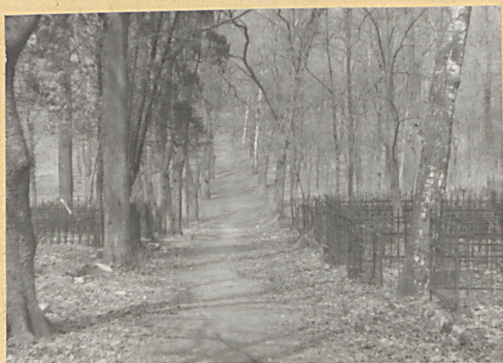
Aleja gł. - widok od południa