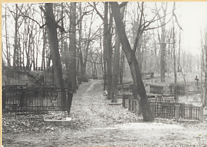
Aleja w pñ. części cmentarza