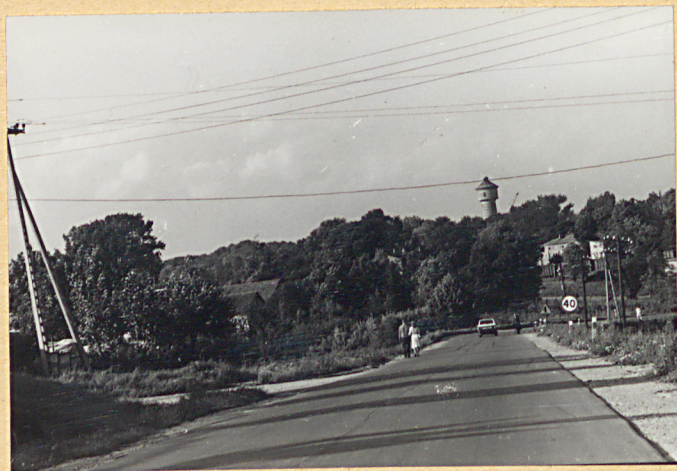
Widok ogólny od str. południowej