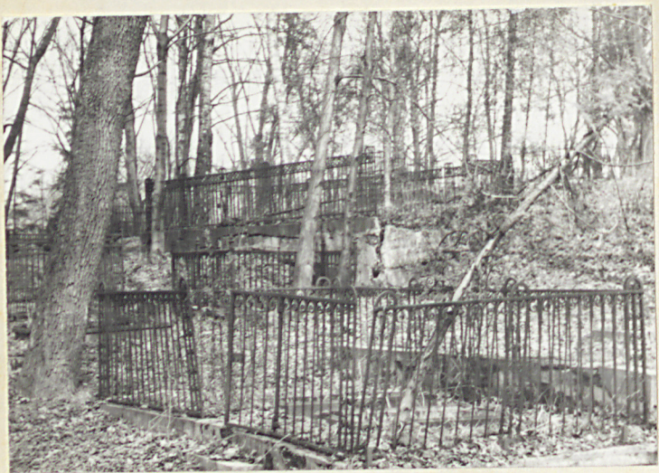
Tarasowo rozmieszczone kwatery rodz. w płn.-zach. części cmentarza