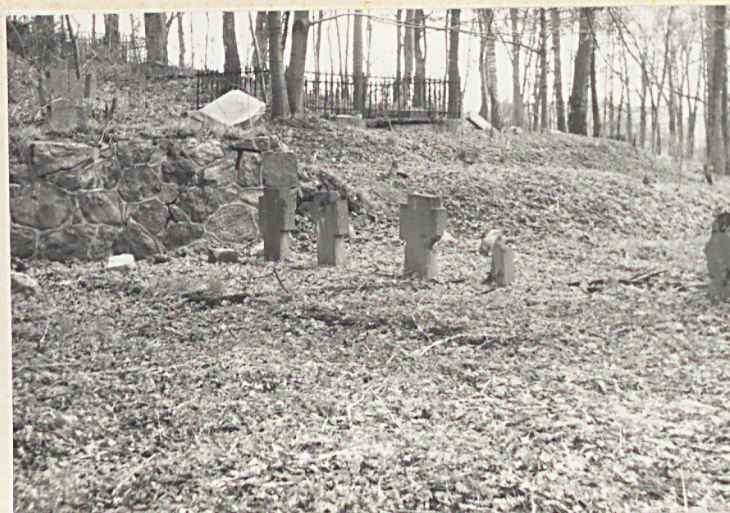
× Krzyże nagr.w pld.części kw.