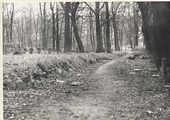
× Taras dolny kw.-widok od pñn.