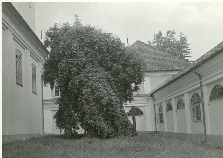
Stan cmentarza w roku 1983