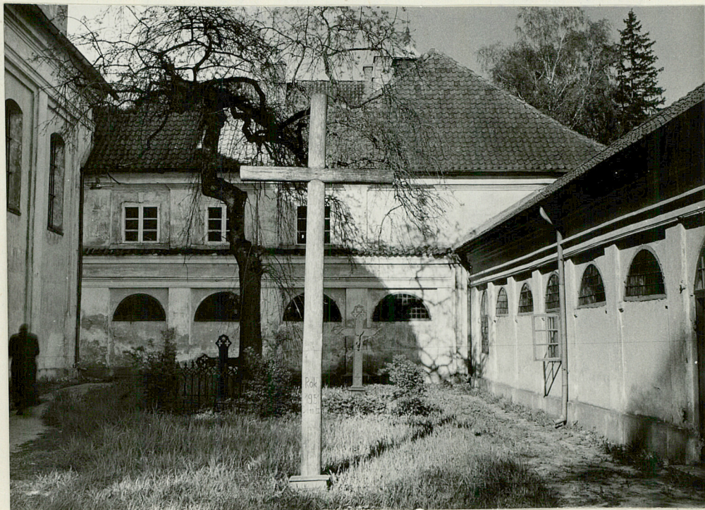
Stan cmentarza w 1964r.