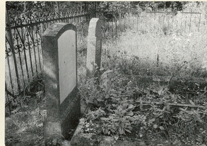
Nagrobek z l. 40-ych XXw