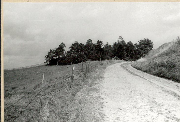
Widok ogólny od pld.-zach.