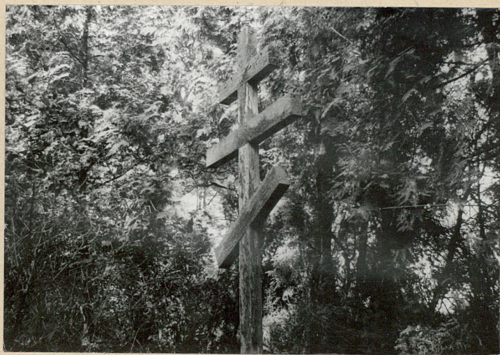
Krzyż na zb. mogile żołn.ros.