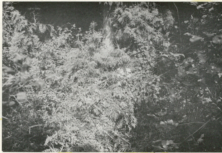
Nagrobek z okr. międzywojennego