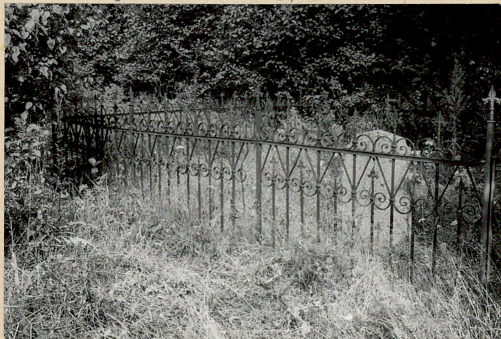
Fragment zachowanej kwatery