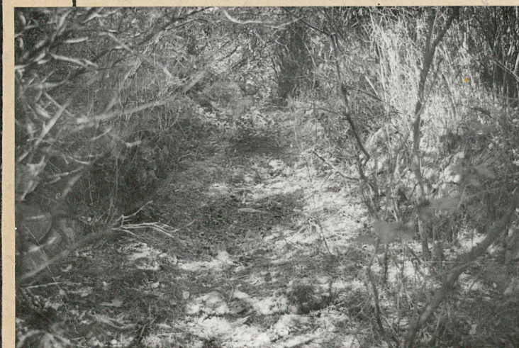
Pozostałości alejki wiodącej do mog.żołn.