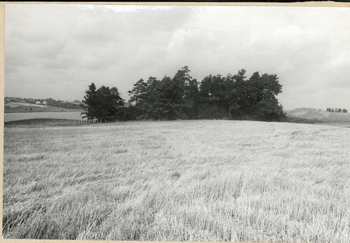
Widok ogólny od pld.