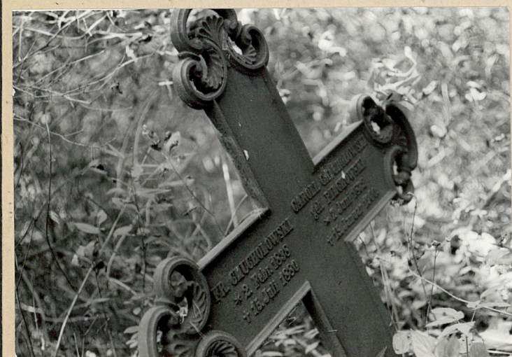
Krzyż żeliwny z 4 ćw.XIX w.