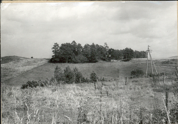
Widok ogólny od zachodu