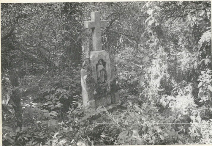
Nagrobek z l. 50-ych XX w.