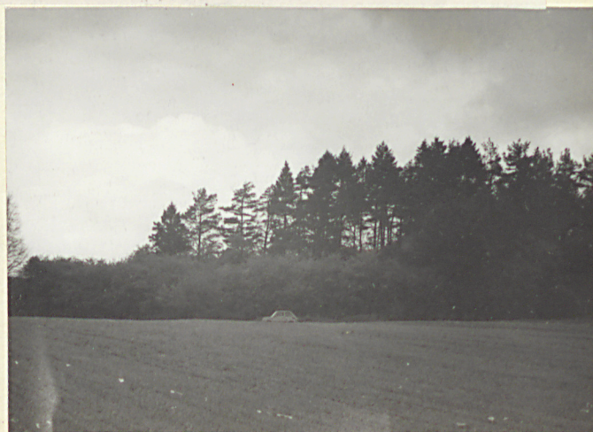
Widok od strony wschodniej