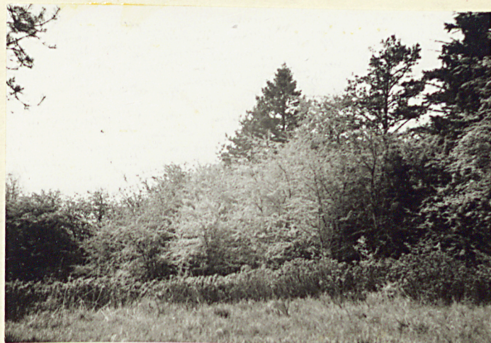
Fragm. cmentarza w części płd.