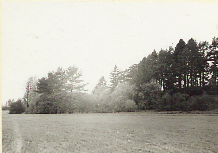
Widok od płd.-wsch