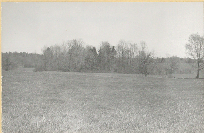
Widok ogólny od południa