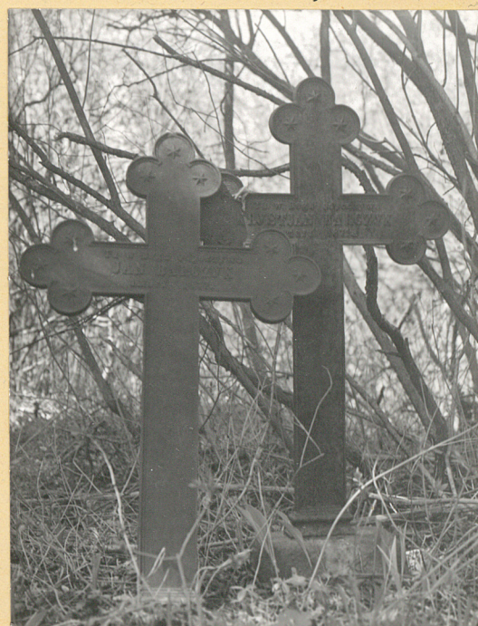
Krzyże żelazne /1871 r., 1877 r./