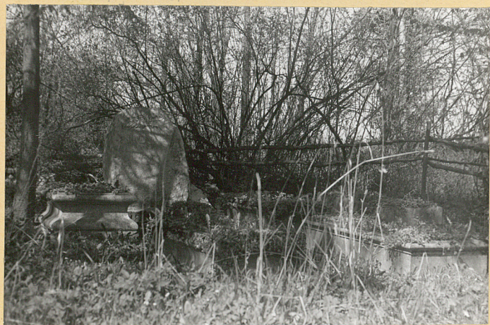
Nagrobki w pld.- zach. części cm.