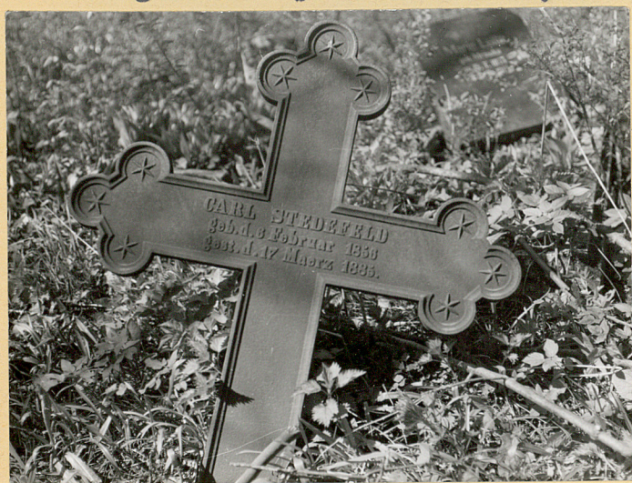
Krzyż żeliwny z 1885 r.