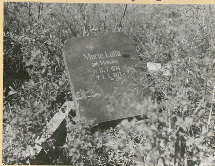
Fragm. nagr. z tablicą /1913 r./