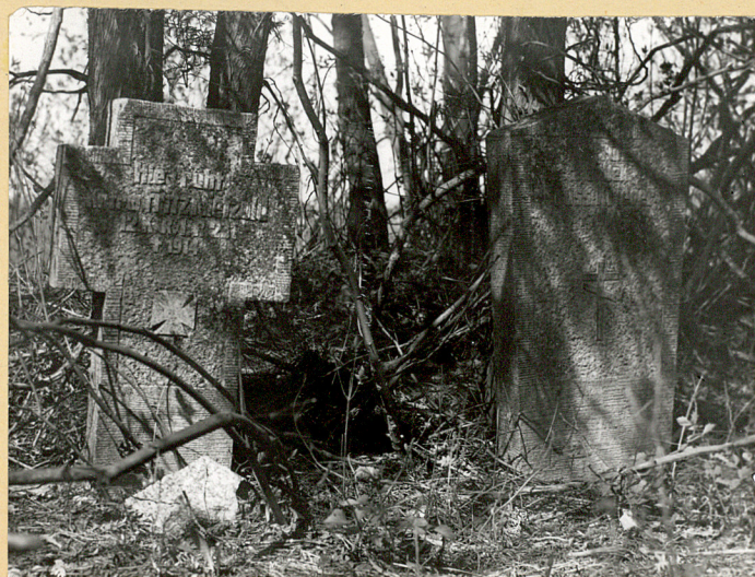
Dwa groby żołnierskie z 1914 r.