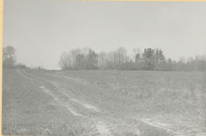
Widok od połudn.- wschodu