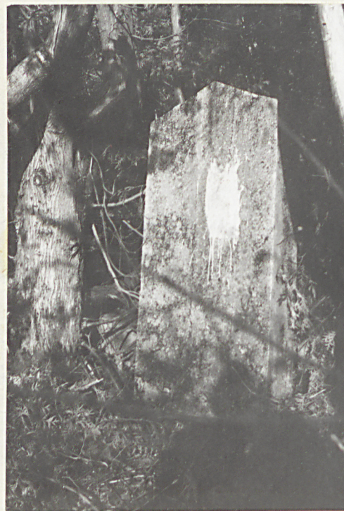
Nagrobki z okresu międzywojennego