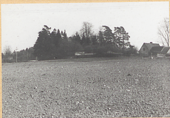
Widok ogólny od płn.-zach.