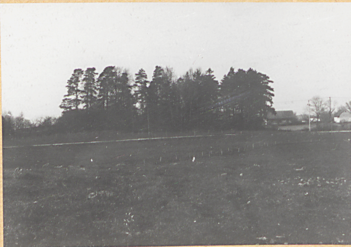
Widok ogólny od płd.