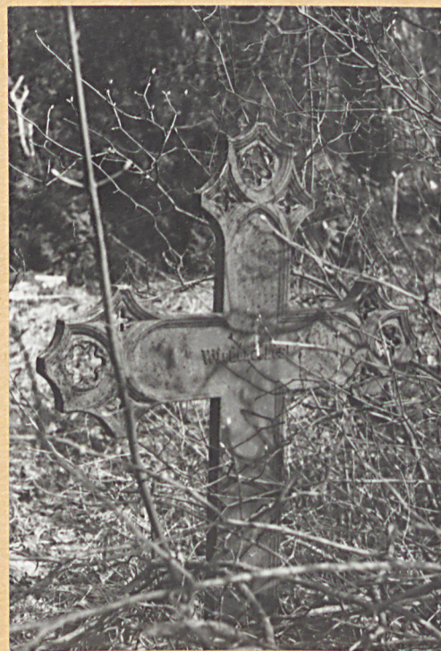
Krzyże nagrobne z k. XIX w.