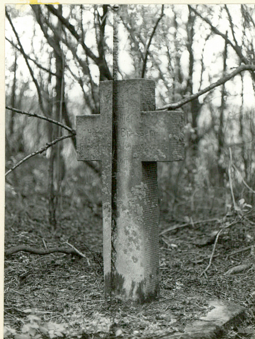
Kwatera wojenna. Krzyż nagrobny