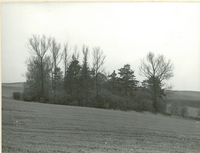
Widok od płn.