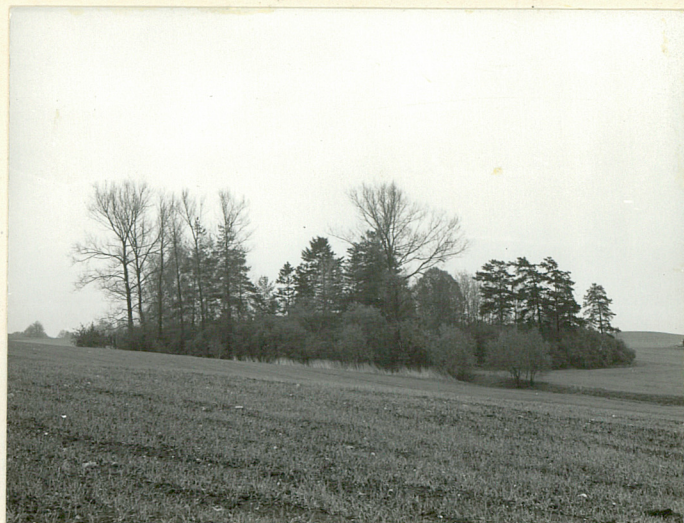
Widok od płn.-zach.