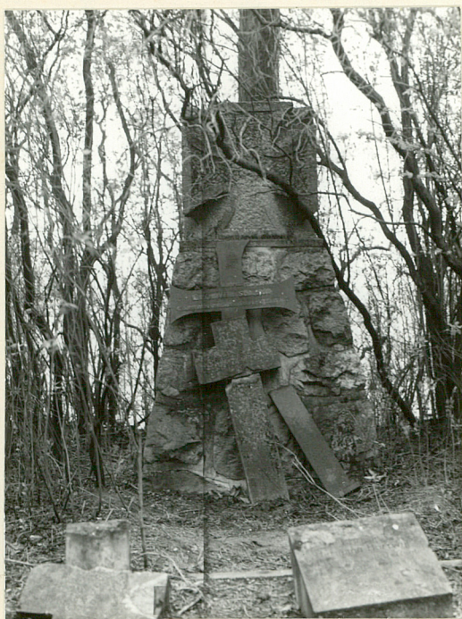
Kwatera wojenna, Pomnik