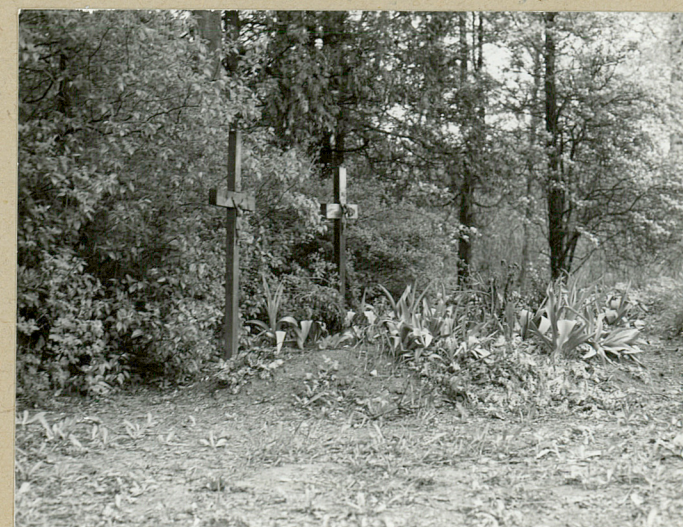
Nagrobki - mogiły

Wkładkę założył: J. Mackiewicz, maj 1984 r. (imię, nazwisko, data)