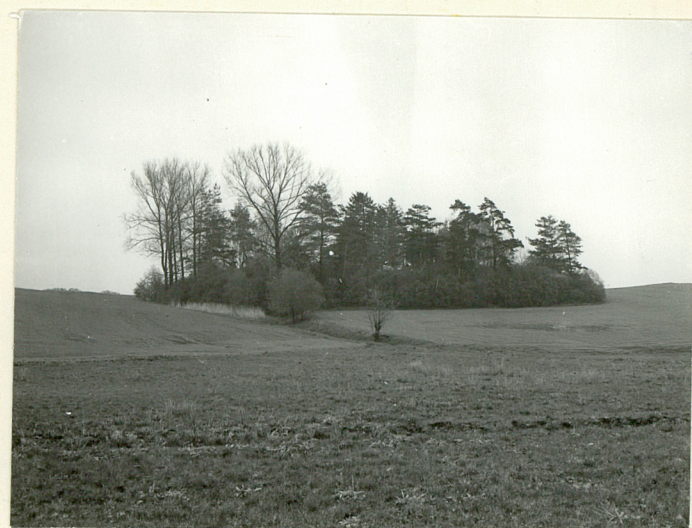
Widok od płd.-zach.