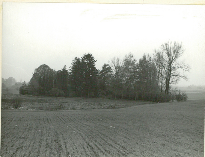
Widok od płd.