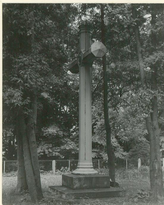
Pomnik - krzyż metalowy