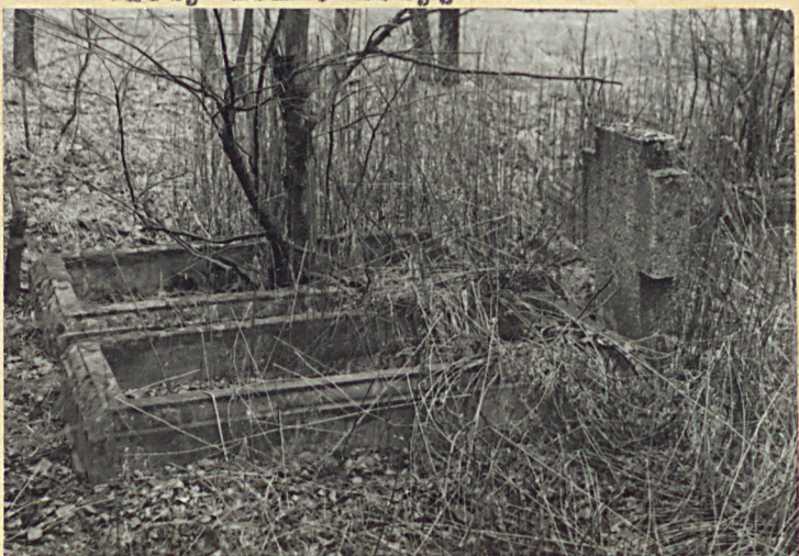
Groby żołnierzy niemieckich z I wojny św.