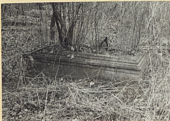
Zachowane nagrobki z 1 połowy XX w.