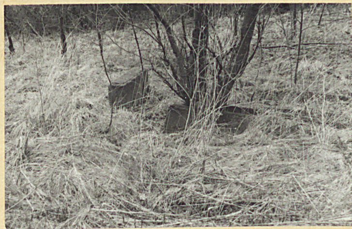
Zachowane nagrobki z 1. poł. XX w.