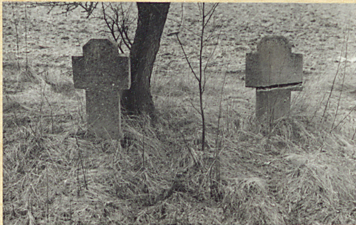
Groby żołn. rosyjskich