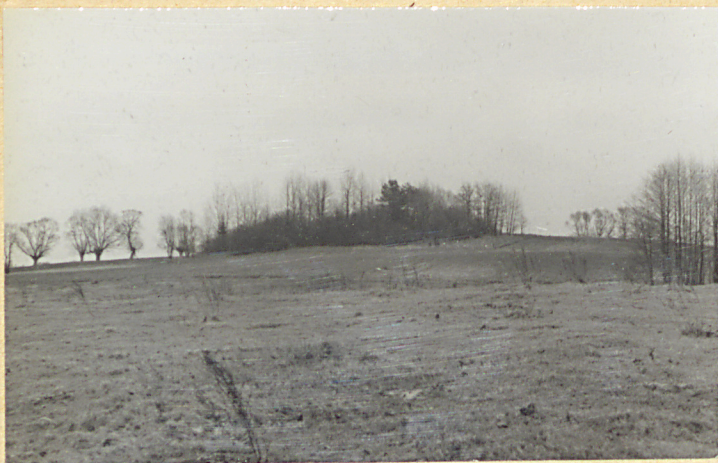
Widok ogólny z zachodu