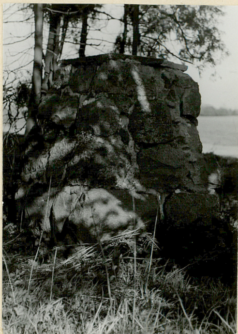
Zachow. słup z głazów w pld.- wsch. narożniku