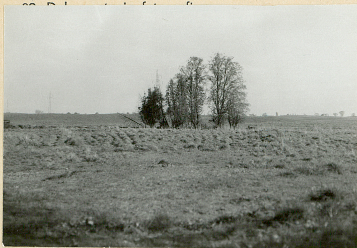
Widok na cmentarz od str. półn.