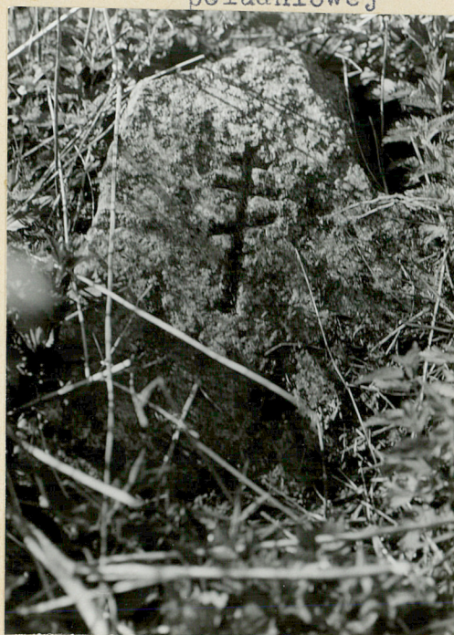
Głaz z wyrytym krzyżem prawosł. (płn. część cment)