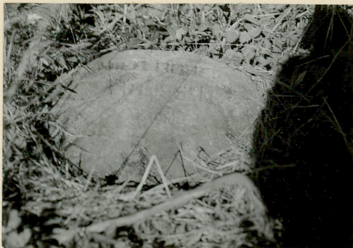
Głaz na mogile zbiorowej (13 poległych żołn. ros.)