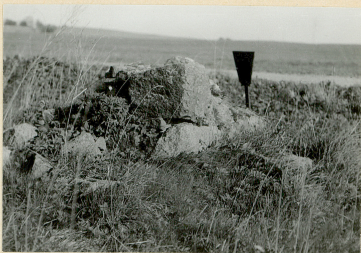
Fragment zniszcz. ogrodzenia od str. - południowej