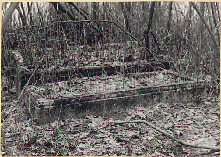
Zachowane nagrobki z I poł. XX w.