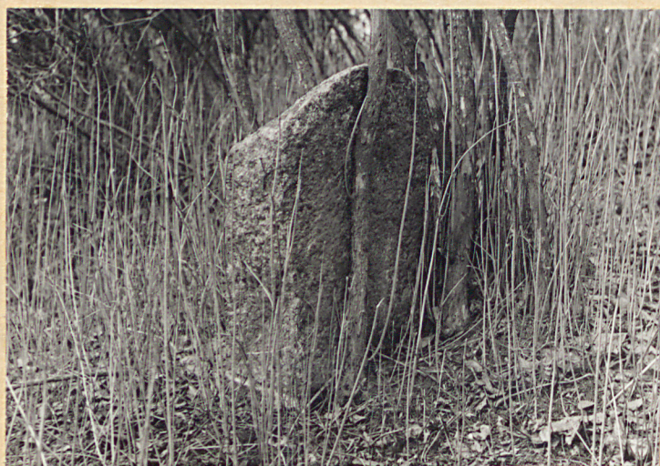
Zachowany nagrobek z k. XIX w. /?/