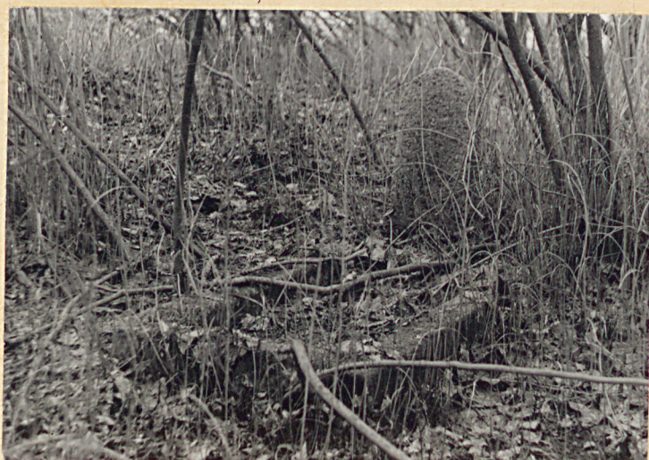
Jeden z zachow. nagrobków