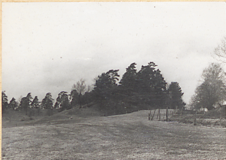
Widok ogólny od pld.- wsch.