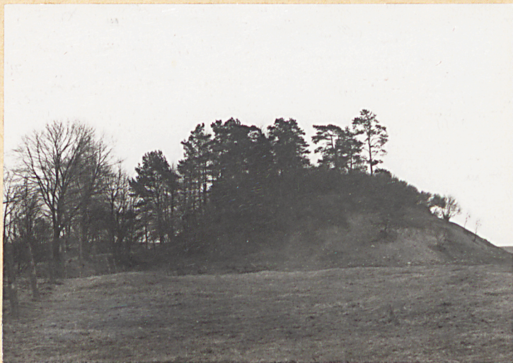
Widok od strony zachodniej