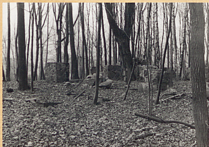
Fragment cmentarza /I/