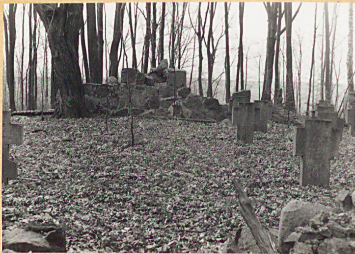
Fragment cment., w głębi - cokół