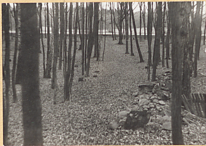
Aleja-widok od str. cmentarza