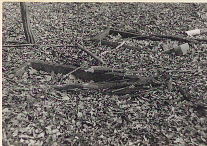
Dwa nagrobki osób cywilnych usytuowane obok cmentarza wojennego /po jego po- łudniowej stronie/