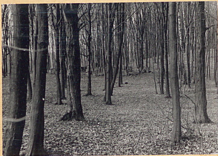
Aleja - widok od str. szosy