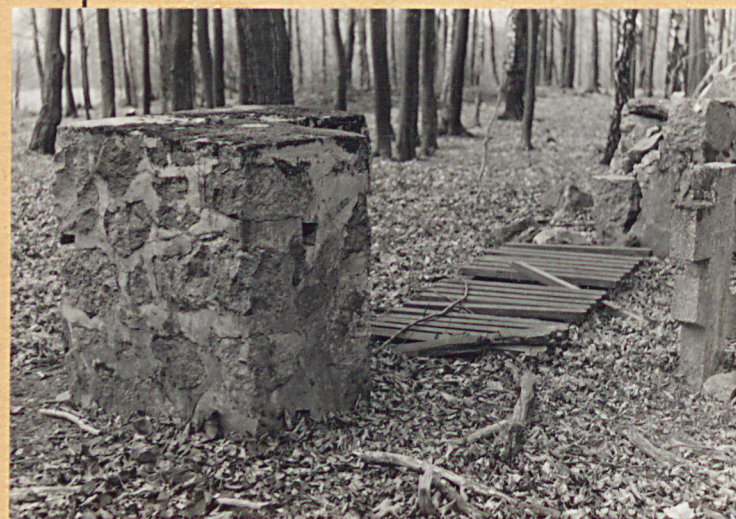
Fragment zniszczonego ogrodzenia