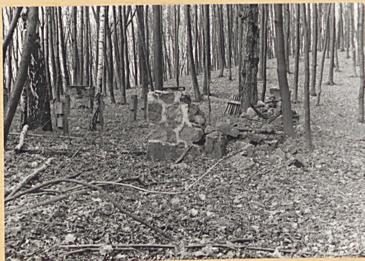
Fragment cmentarza /II/