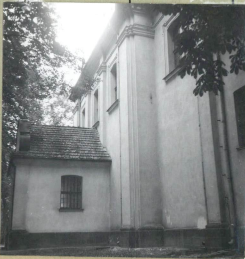
SITUACJA, PLAN i ZDJĘCIA - SŁ