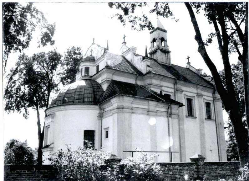
Fot.3 Kościół od północy.

3. Zawartość wkładki (nazwa obiektu lub materiału uzupełniającego) 2 fotografie, 1 plan