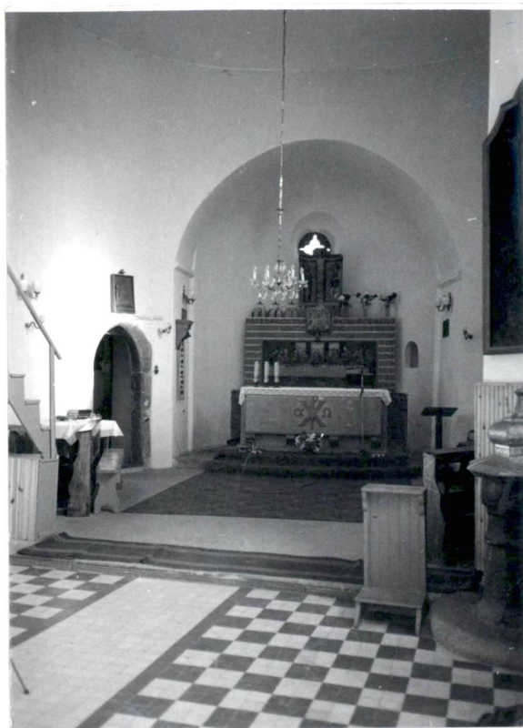
Wnętrze - widok na apsydę.