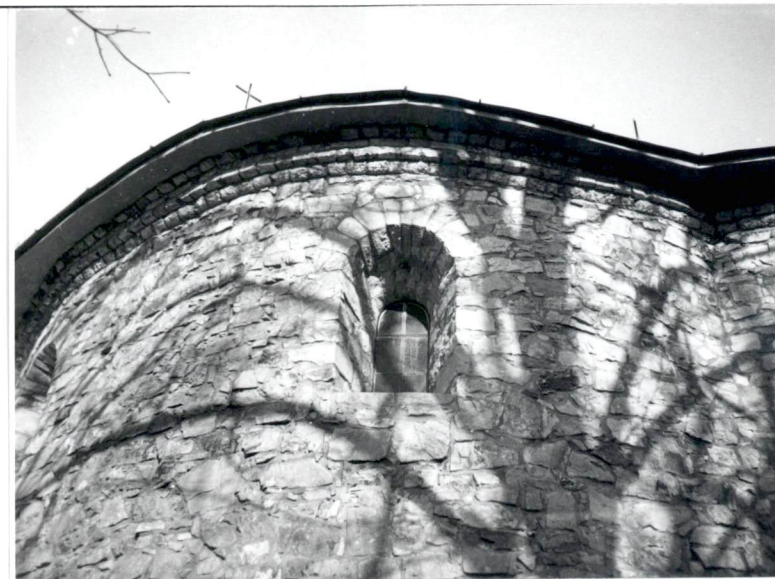
Okienko w prezbiterium kościoła. Okienko z maswerkiem w apsydzie.