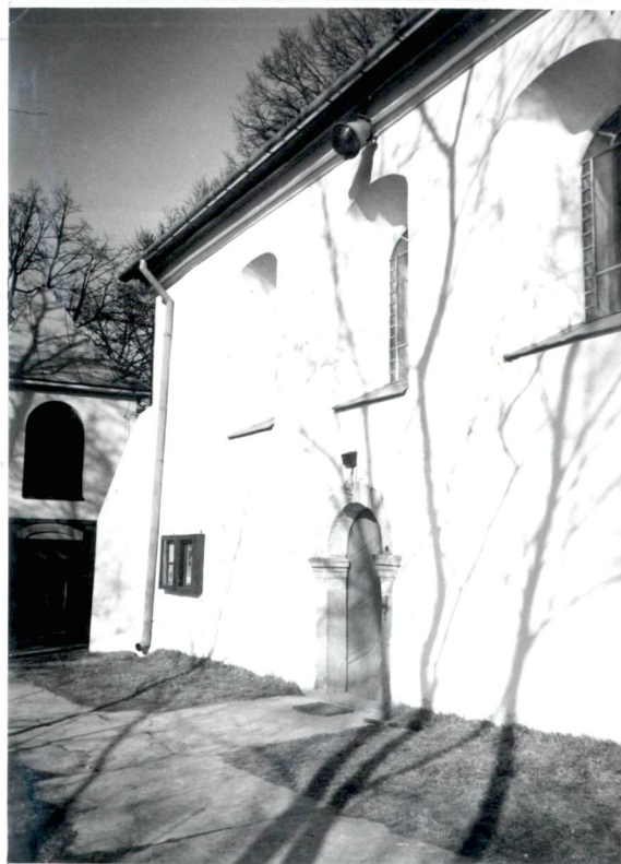
Elewacja pd. kościoła.