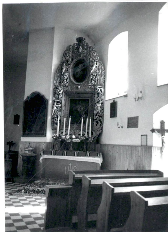
Wnętrze - widok na narożnik nawy /pd.-wsch./.