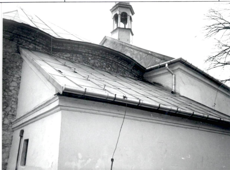
Dach nad zakrystią.