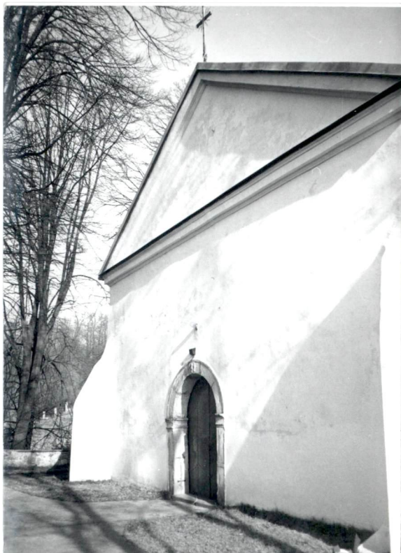
Elewacja zach. kościoła.