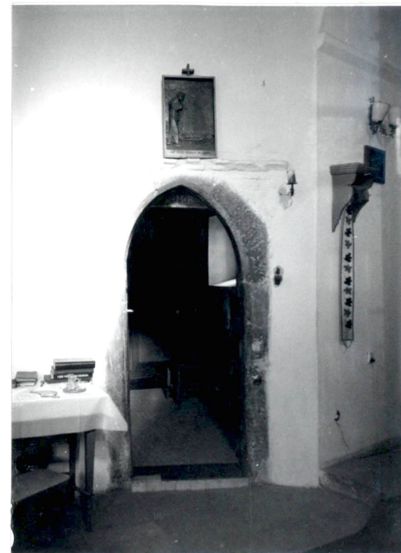
Wnętrze-portal do zakrystii.