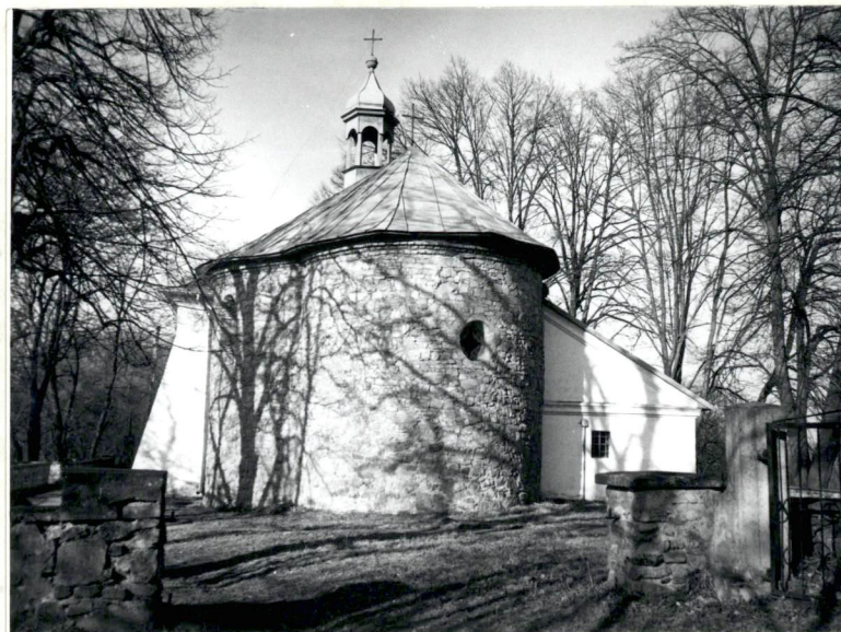
Kościół - widok od strony wsch.