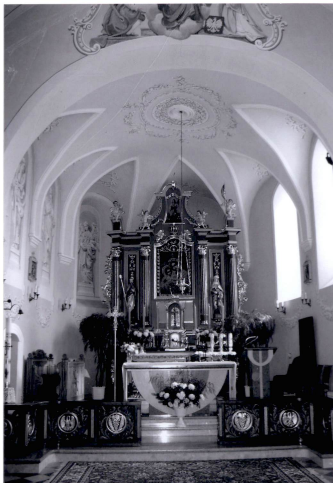
2. Wnętrze, widok na prezbiterium