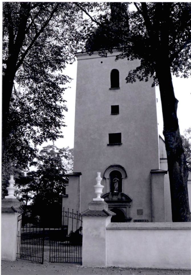
1. Widok na fasadę