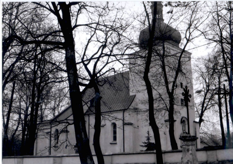
Kościół od strony północno-zachodniej