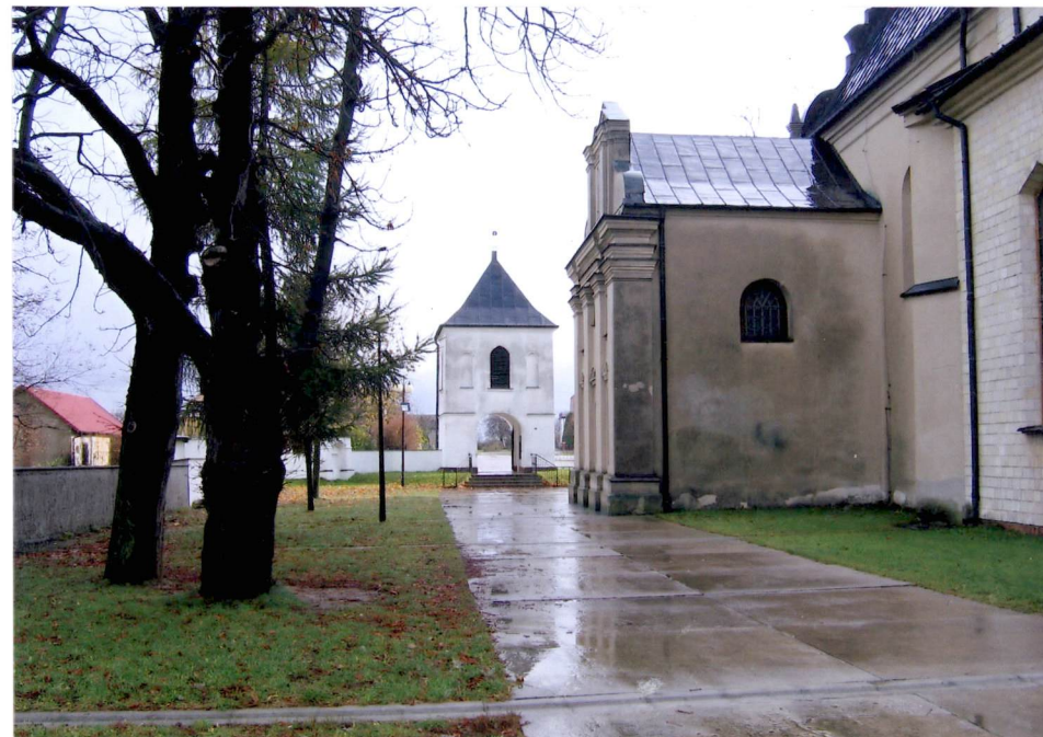
Plac przykościelny po stronie pn. kościoła.

Kapliczka w linii ogrodzenia - po stronie pd. kościoła.