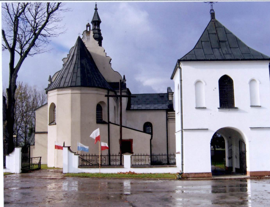
WIDOK NA ZESPÓŁ OD WSCHODU