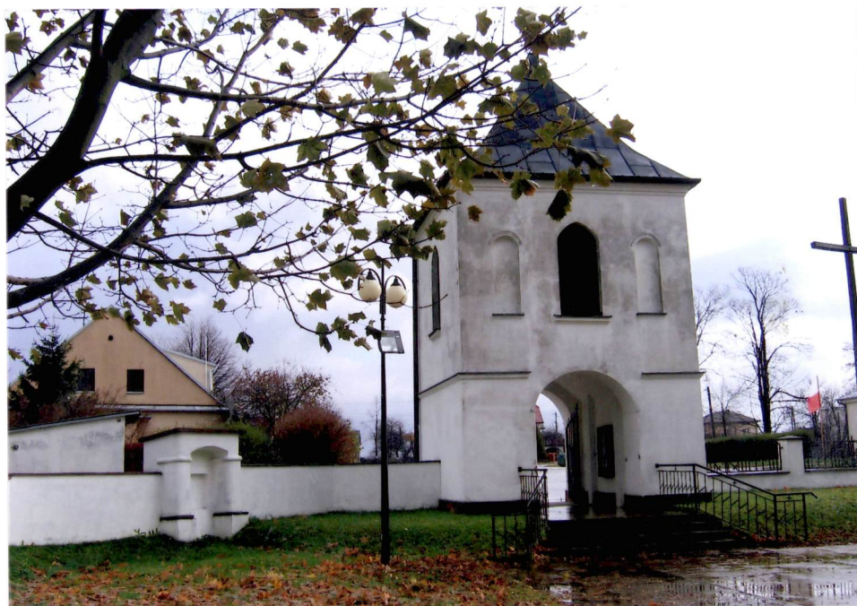
Dzwonnica i kapliczka - widok od zachodu.

Plac przykościelny - widok z przejścia bramnego na kaplicę z XVII w.