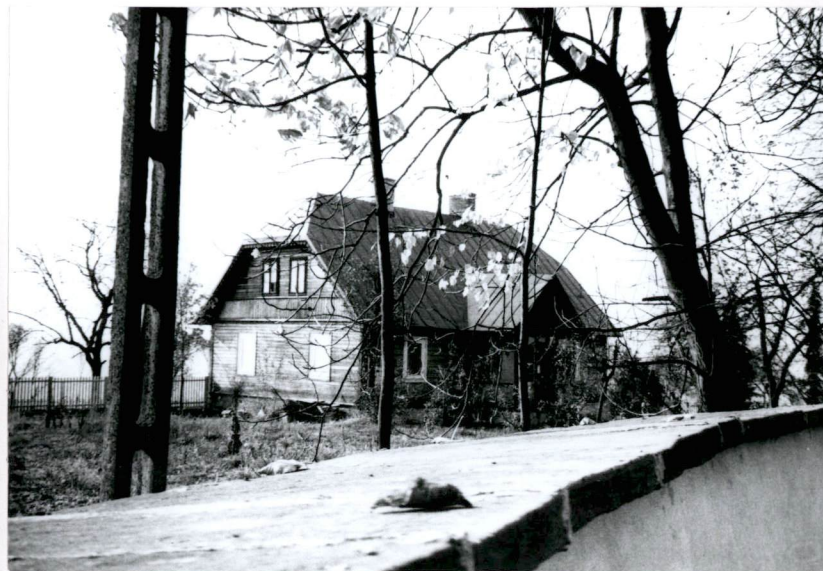
Widok plebanii - od strony pn.-wsch.

Wkładkę założył: mgr Anna A DAMCZYK X.2000 (imię, nazwisko, data)