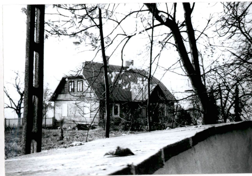
Widok plebanii od strony pn.-wsch.