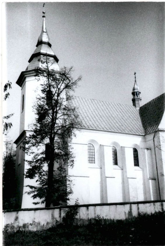
Widok kościoła i ogrodzenia od strony pd.