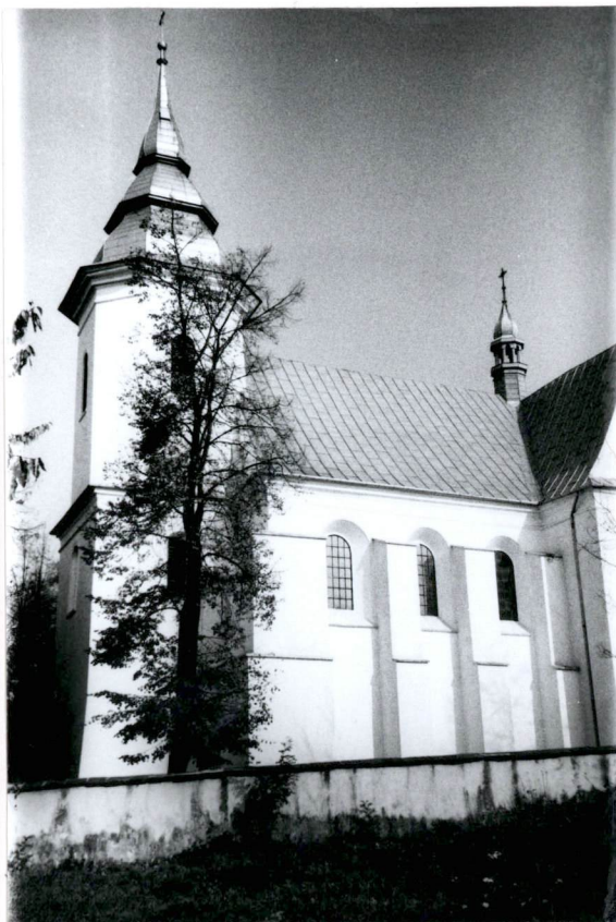
Widok na kościół i mur ogrodzenia od strony pd.