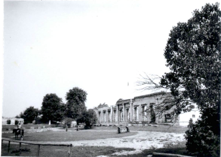
1. fasada pałacu, widok od wschodu