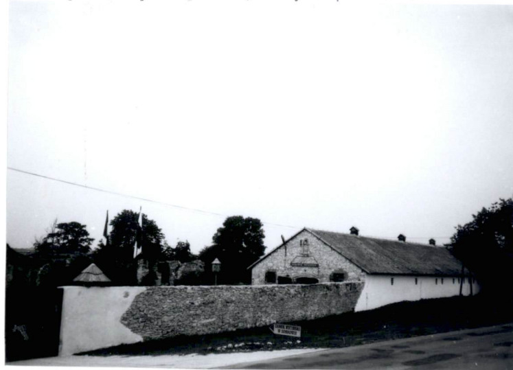
2. budynek stajni oraz mur, skrzydło północne