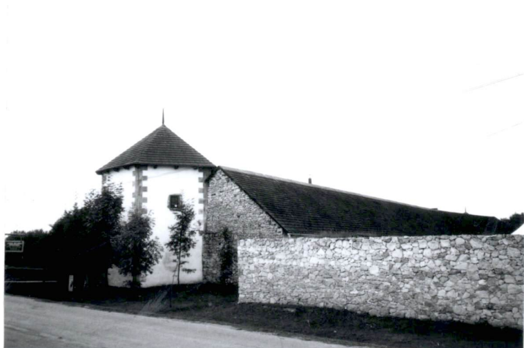
7. majdan, w głębi skrzydło zachodnie