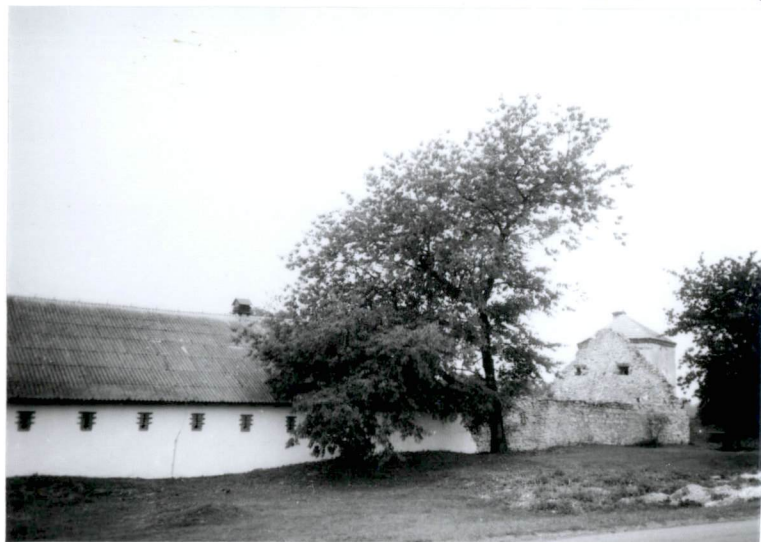
3. budynek stajni oraz pozostałości budynku gospodarczego, skrzydło pn.