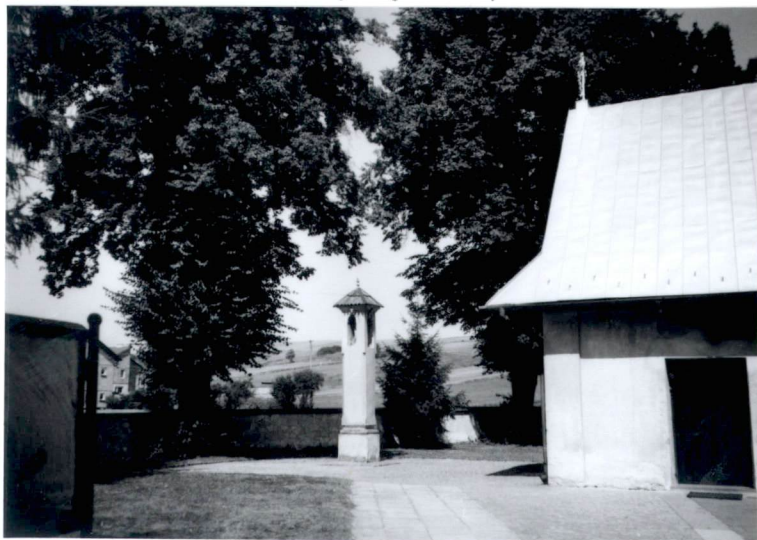
3. kapliczka, w zachodniej części zespołu