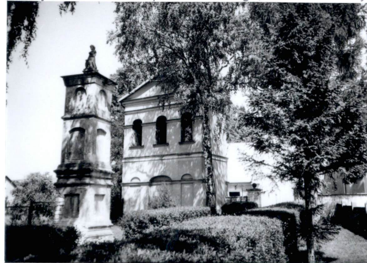
2. wejście na teren zespołu kościelnego, od ul. Kieleckiej