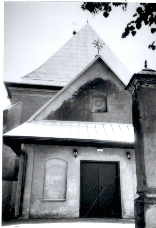
6. widok na elewację zachodnią kościoła