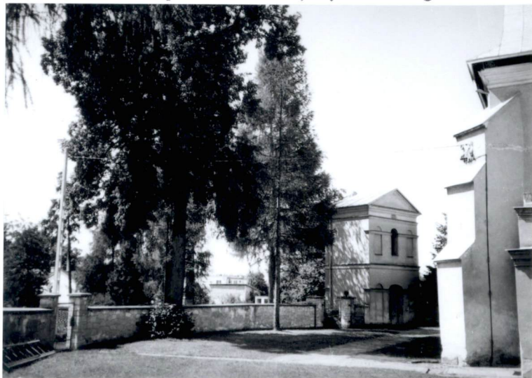
1. Południowa część cmentarza przykościelnego