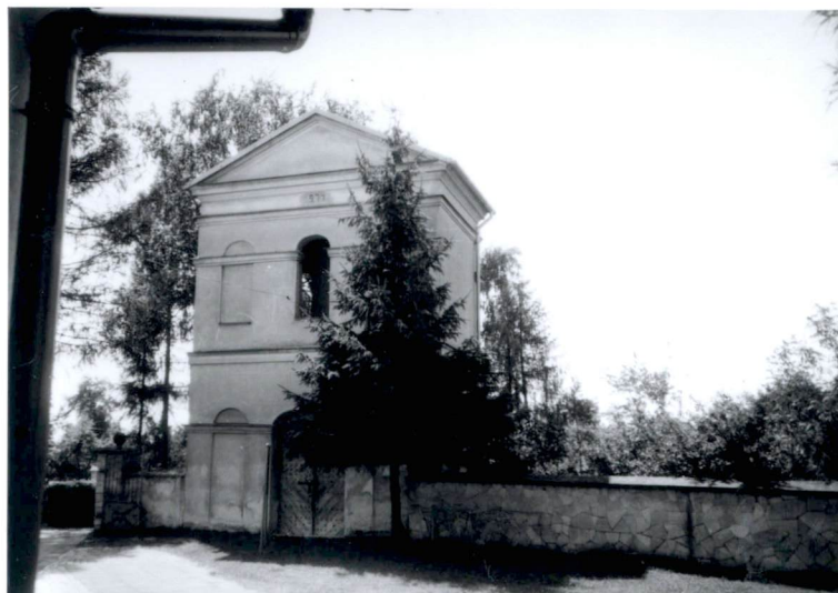
5. dzwonnica, elewacja północna