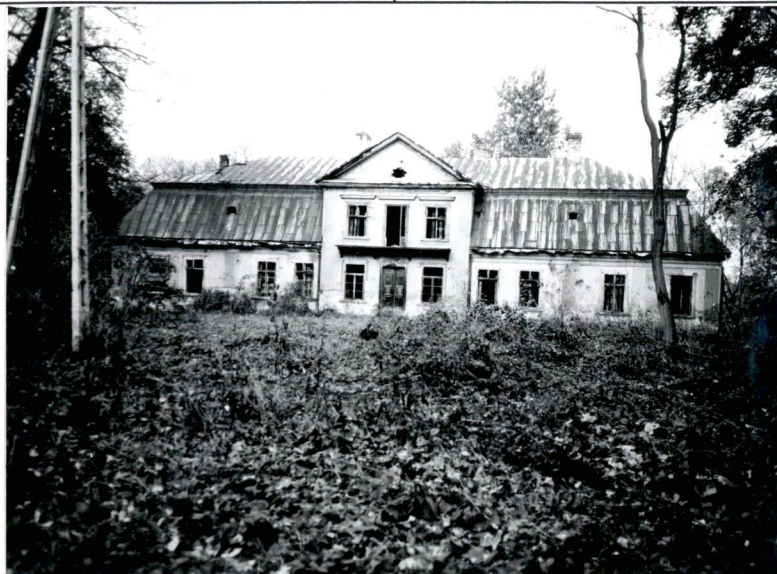
Fasada, elewacja pd./ dworu.

3. Zawartość wkładki ( nazwa obiektu lub materiału uzupełniającego ) Zdjęcia.