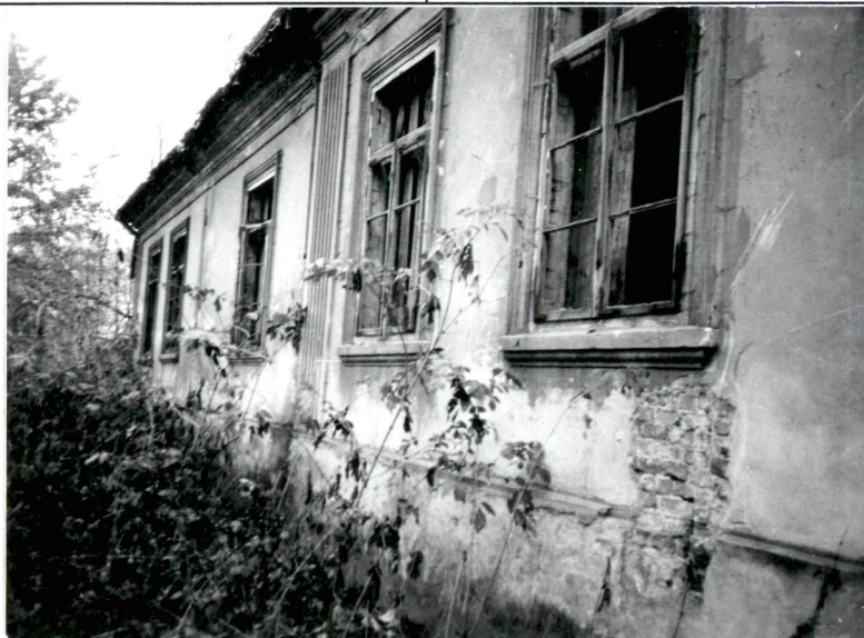
Fragment elewacji pn. dworu.