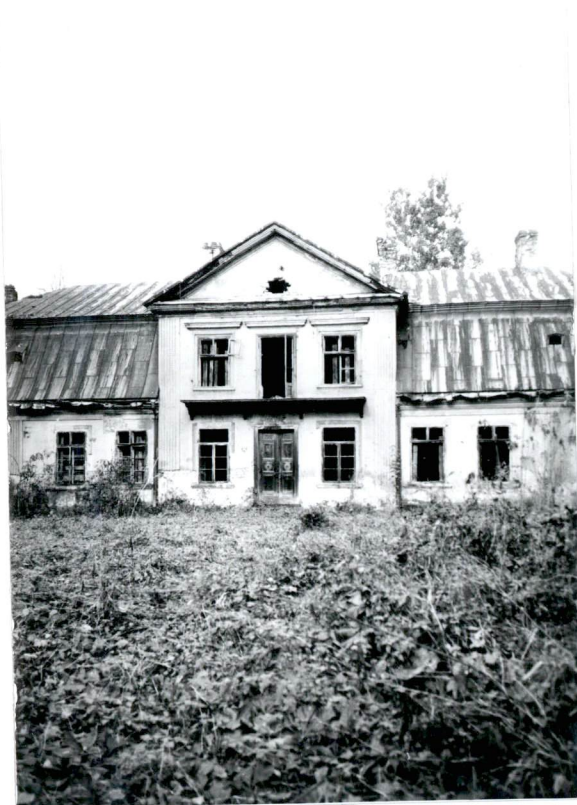
Ryzalit fasady. Widok od pd.