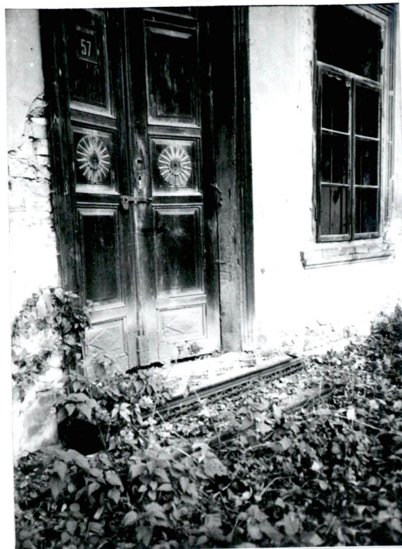
Ryzalit fasady /fragment/ Drzwi wejściowe poprzedzone żeliwnymi schodkami.