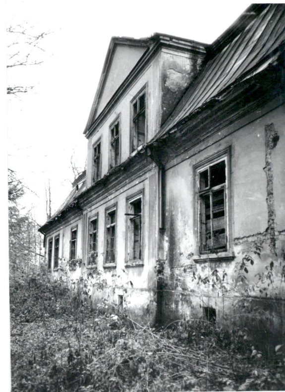
Widok na elewację pn. Od strony zach.