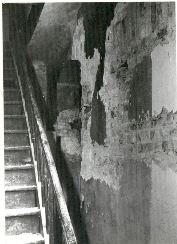
wnętrze zachodniej części sieni ze schodami na poddasze