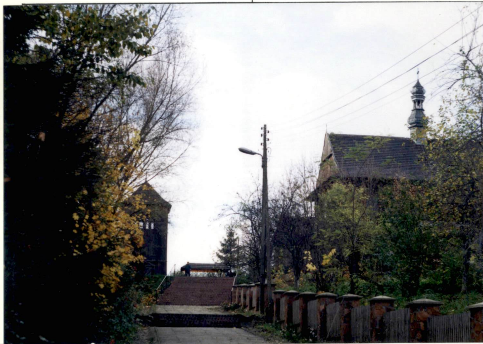
Widok zespołu od wsch.