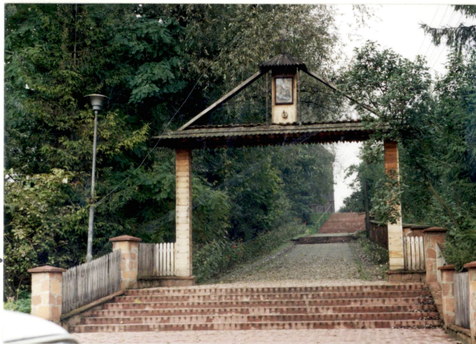
- Brama do zespołu kościelnego i schody.