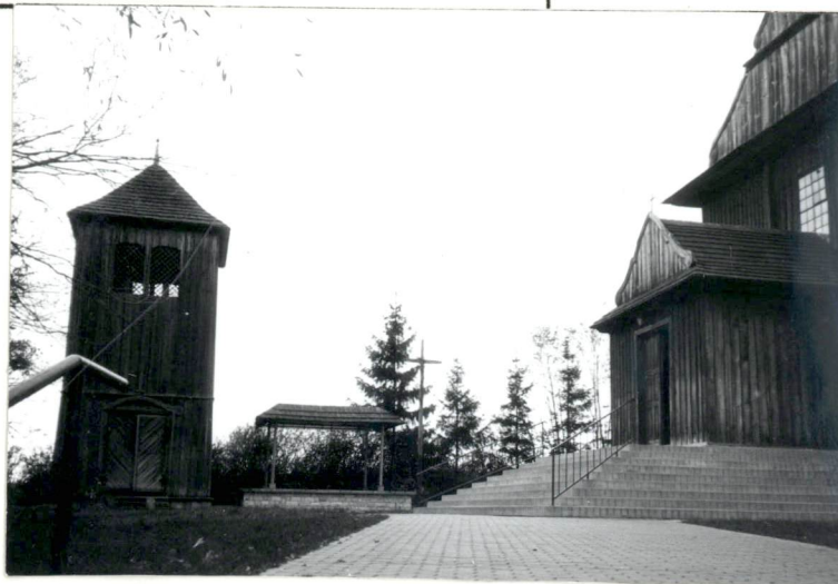
Widok na kościół i dzwonnice.