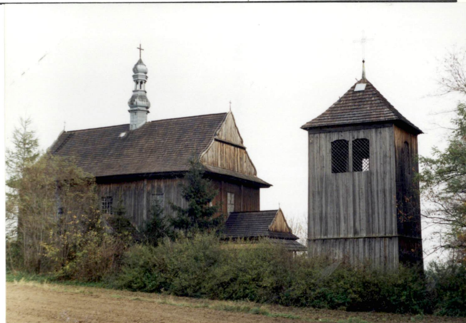
Widok zespołu od zach.