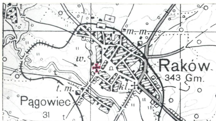
Rys.2 Plan orientacyjny