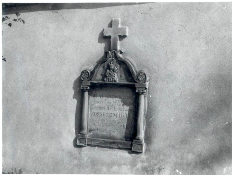
Fot.5 Epitafium na murze kościelnym.