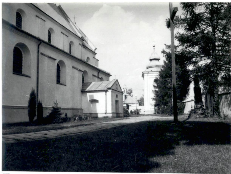
Fot.2 Plac kościelny od wschodu.