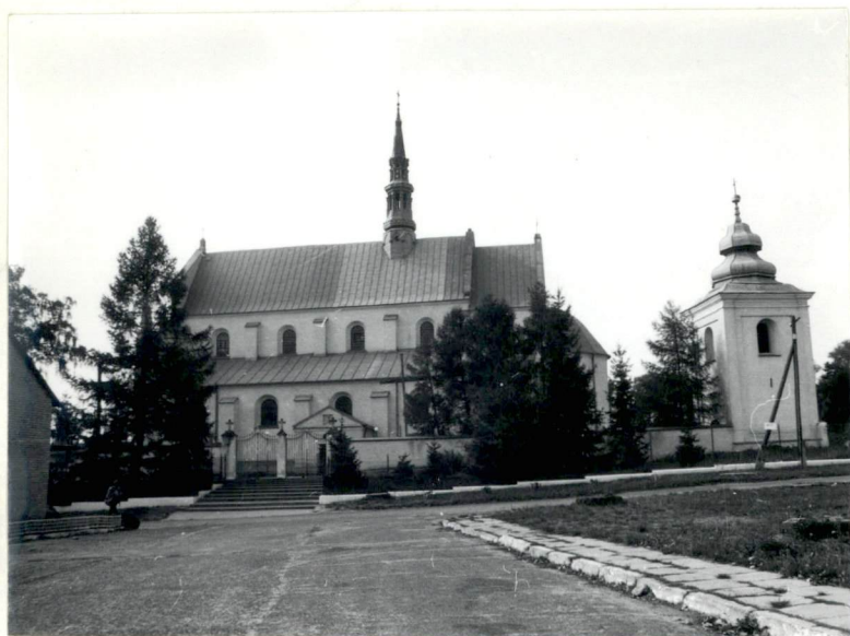
Fot.1 Widok kościoła od południa

11. Zdjęcia. rzut, przekrój, sytuacja, orientacja