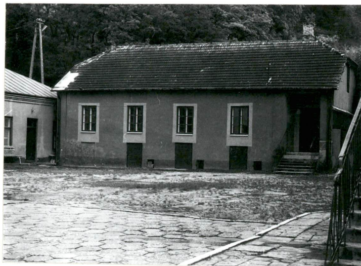
Budynek po stronie pn.dzielnicy - obecnie sala gimnastyczna