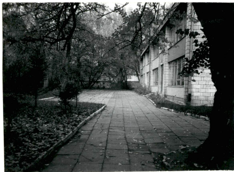
Teren zajęty przez Liceum - dawny ogród włoski z zachowanym odcinkiem zach. muru.