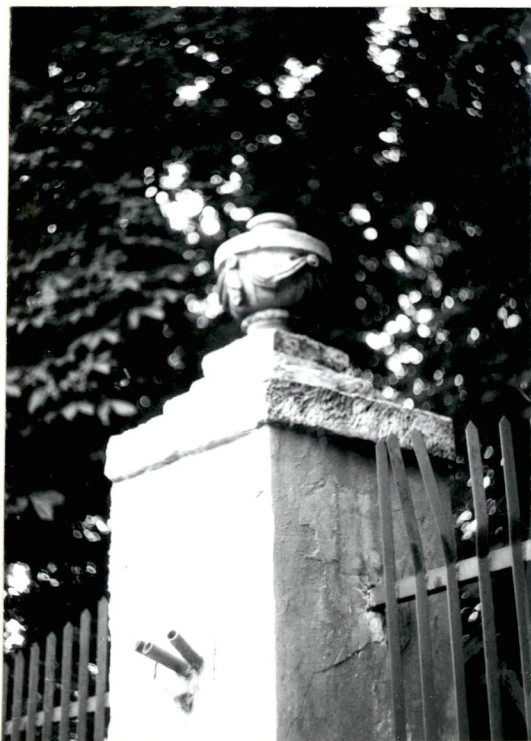
Filar ogrodzenia parkowego.