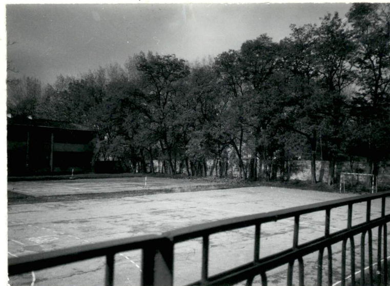
Widok na odcinek muru zach. dawnego ogrodu włoskiego.