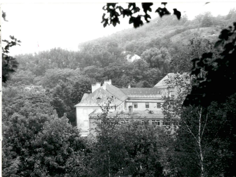
Widok zespołu pałacowego z Wzgórza św. Anny.