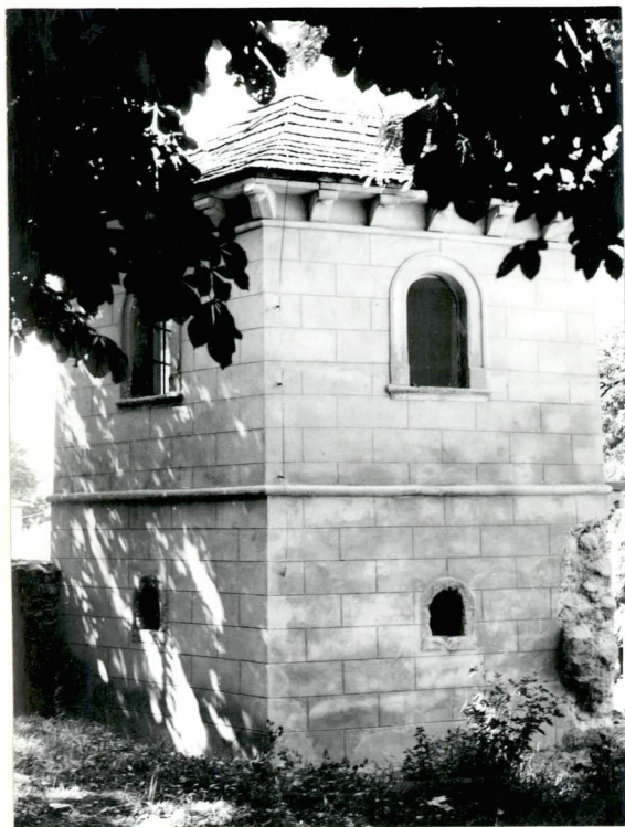
Baszta w pd.-zach. narożniku parku pałacowego - muzeum liceum im. H.Kołłątaja