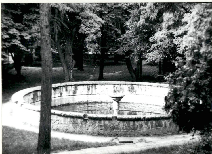
Zbiornik wodny w parku przypałacowym