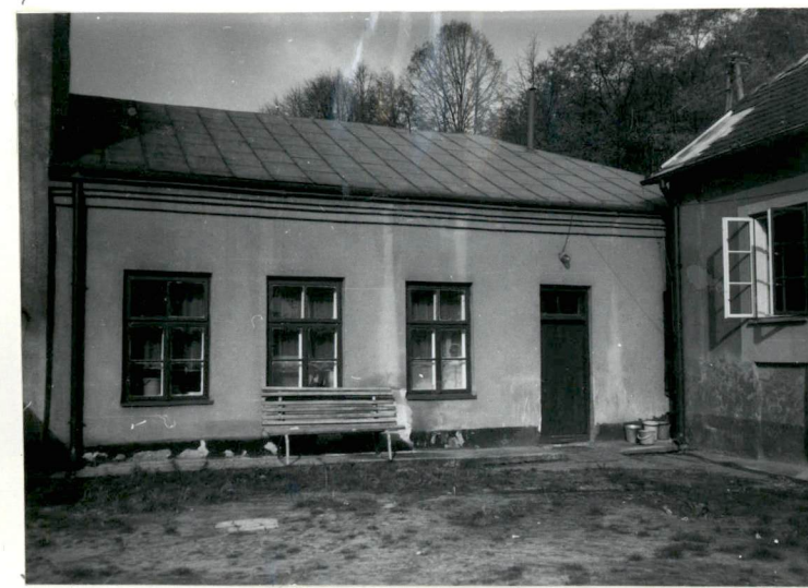
Budynek po stronie wsch. dzielnicy - obecnie kuchnie internatu.