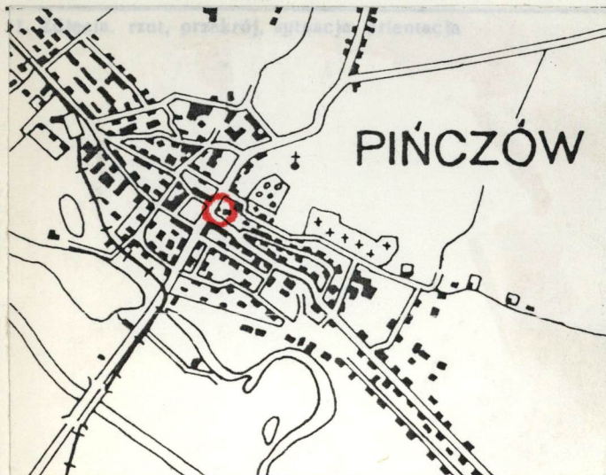
Plan orientacyjny dzwonnicy - skala 1:25000 (odrys z mapy-stan z 1974r.)