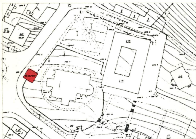
Plan sytuacyjny dzwonnicy - fragm. planu m. Pińczowa z 1962r. - 1:2000