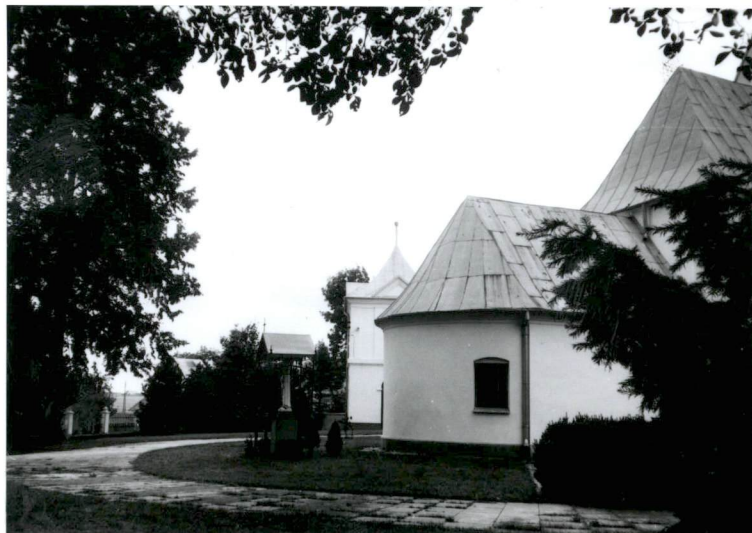
1. Widok na teren cmentarza od północy