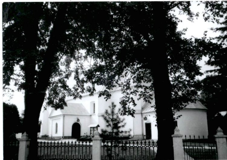
2. Widok na zespół kościoła par. od strony pd.-wsch.