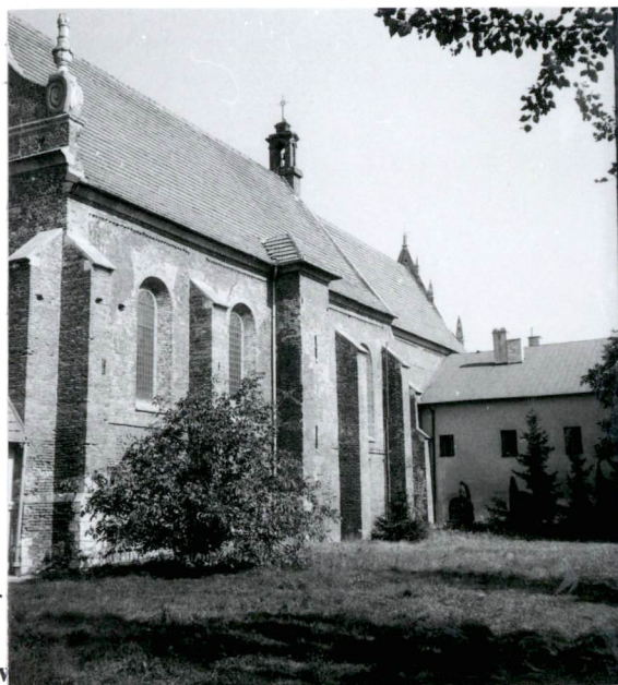
Widok zespołu od pd.-zach.