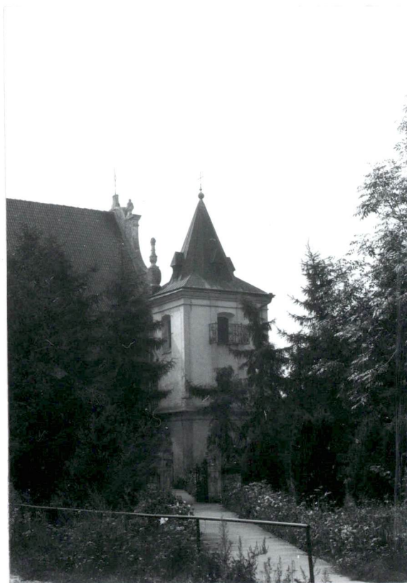
Dzwonnica - widok od pn.- wsch.