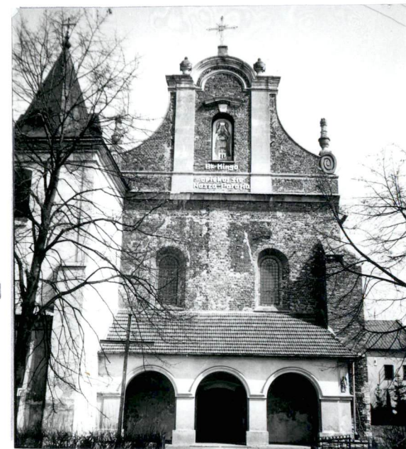
Widok kościoła od strony zach.