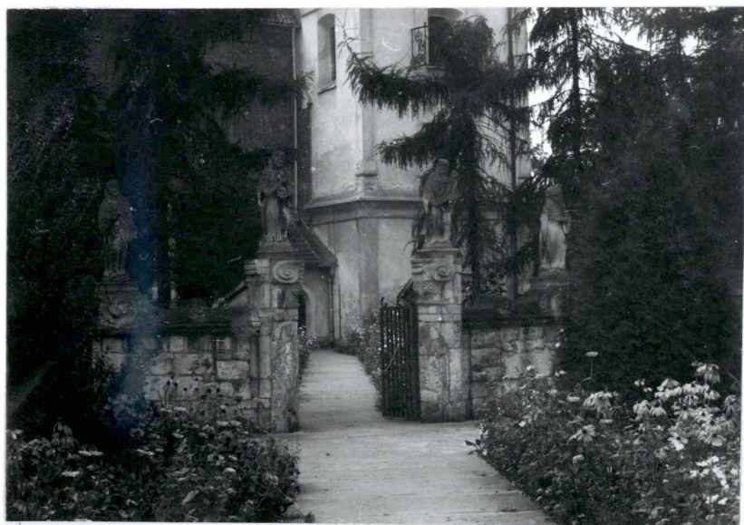
Bramka na dawny cmen- tarz przykościelny.