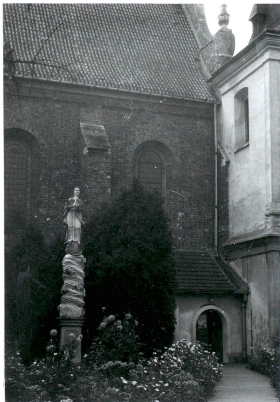
Widok na kruchtę pn. kościoła i figurę N.M.P.