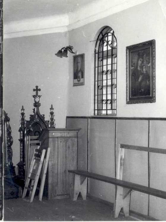
Wnętrze - ściana pd. /fragment/.