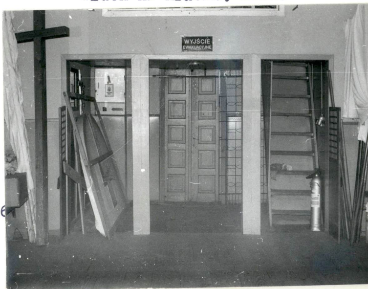
Widok na kruchtę zach.