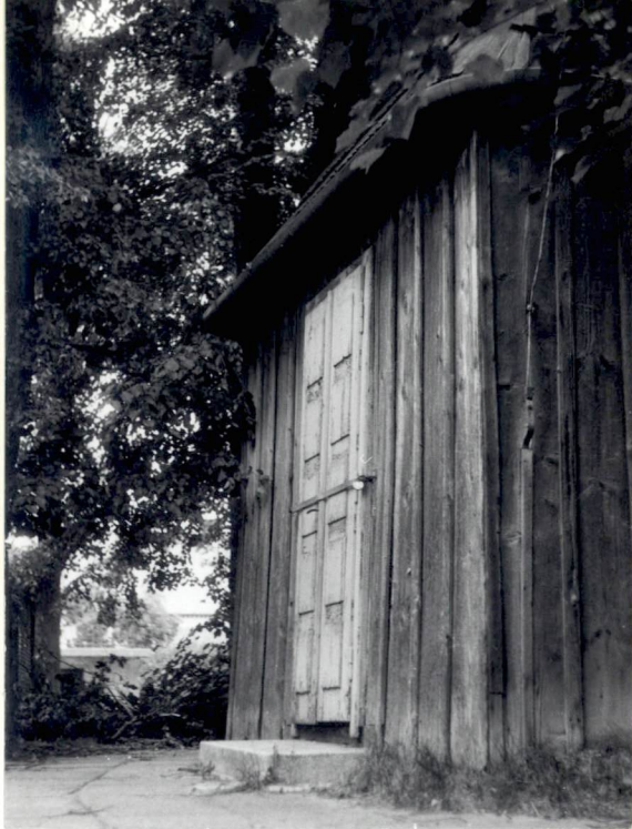
Wejście główne od zach.