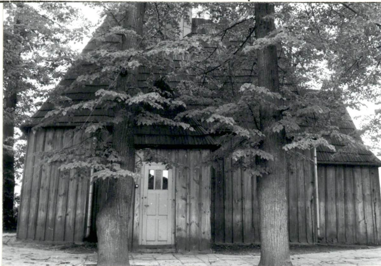
Widok od pn.