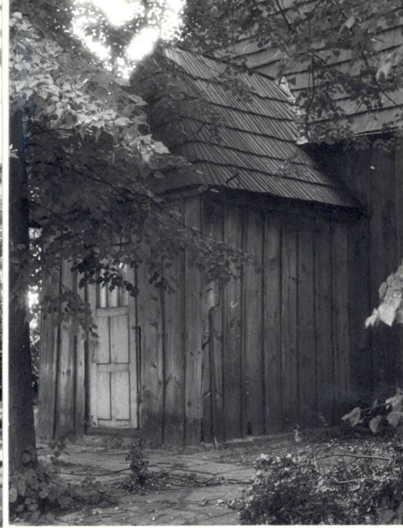
Zakrystia po stronie pn.