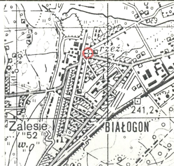
Plan orientacyjny - skala 1:25000 wg mapy z 1974 r.