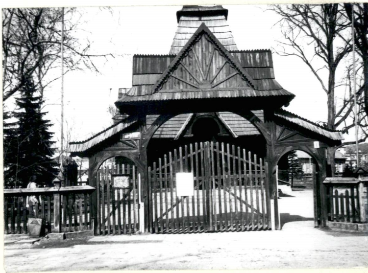
WEJŚCIE GŁÓWNE OD STRONY PD.