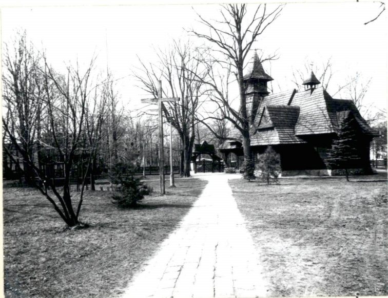
WIDOK OD STRONY PN.-WSCH.

Ponadto w 1991 r., na wsch. od kościoła powstał ołtarz polowy pod gontowym zadaszeniem.