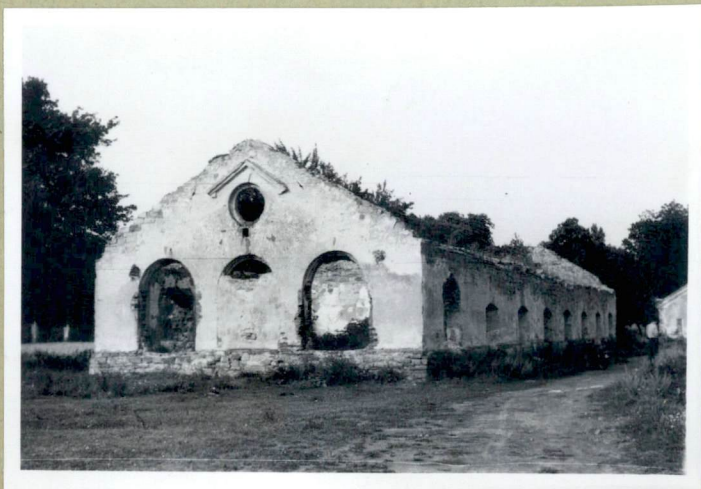
Widok od str. poł.

Umieszczona na wzdłużnej osi iadolewisk respoła; na rucie wydłużonego protolista z trzewiem podpiwniczym, przesłoniętych pomianem proto- kstyckich i na pd-rach. Krawie jedynym, admi- nistracyjnym pomianem kwadratom. Cenne natryta pierwotnie dachem dwuspadowym z murowanymi tynkami ozdobnymi oluszkami oluszkami. Otwory wejściowe zamknięte ostro- kono, w kwadratowym kantorku w skłanie tyn- kowej potrojne olina arkadowe (jedno murowane)