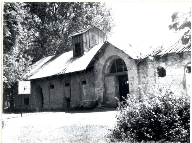
STAJNIA I MAGAZYN (WIDOW PN.) FRAGM.