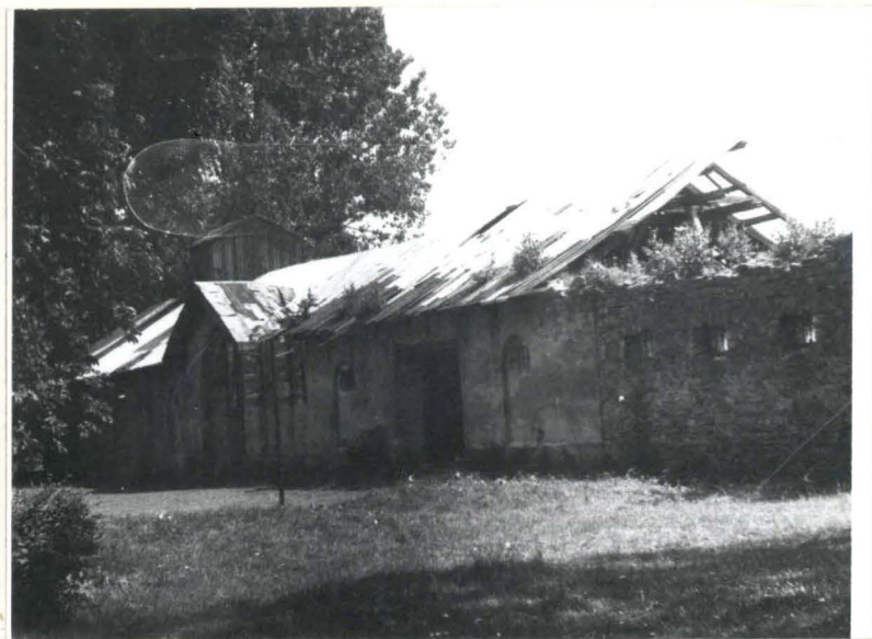
STAJNIA I MAGAZYN (WIDOK PN.)