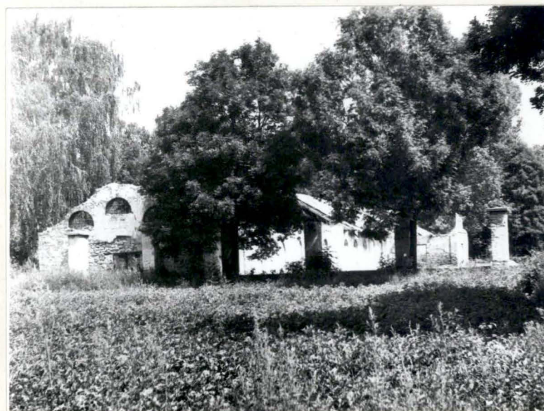
STAJNIA I MAGAZYN (WIDOK PD.-ZACH.)