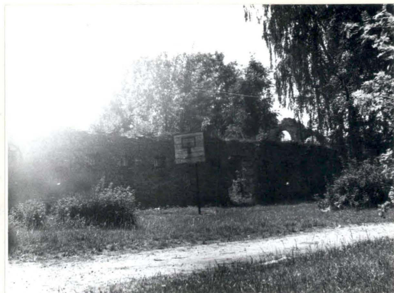
STAJNIA I MAGAZYN (WIDOK PN.) C.D.