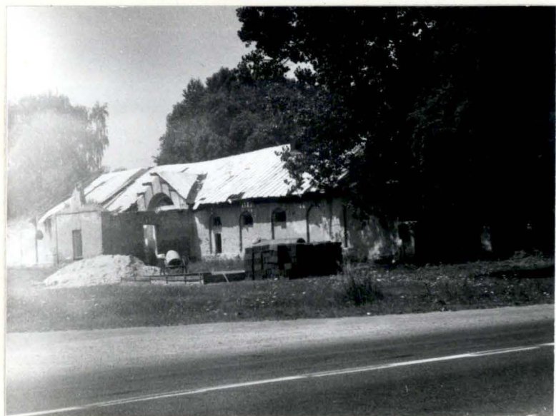
STAJNIA I MAGAZYN (WIDOK PD.-WSCH.)