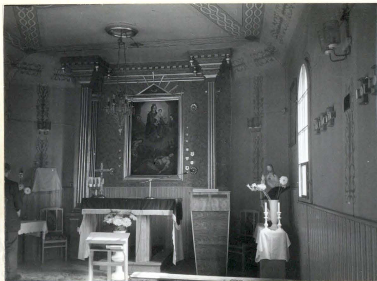
Wnętrze kaplicy - widok na prezbiterium.