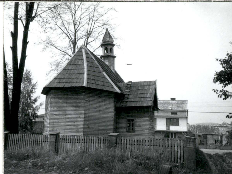
Widok kaplicy od pn.-wsch.