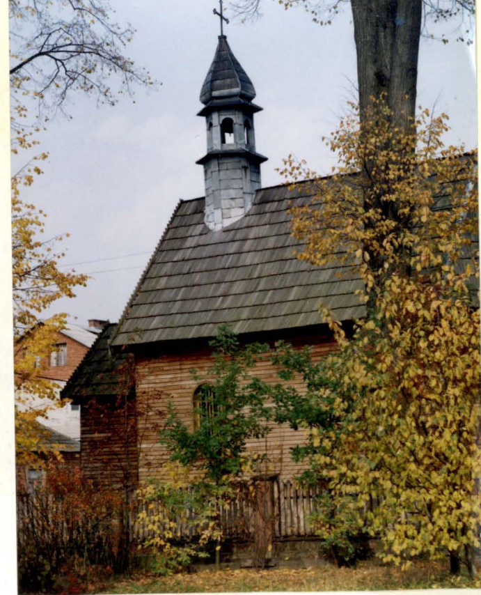
Widok na kaplicę od pd.