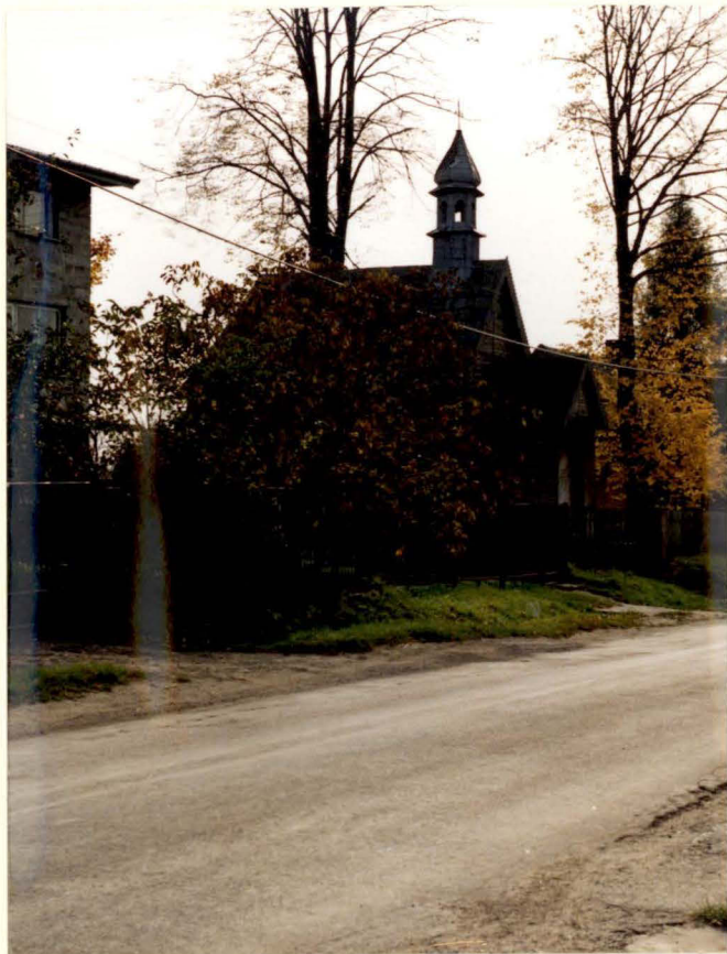
Widok kaplicy od pn.-zach. Kaplica - od pd.-wsch.