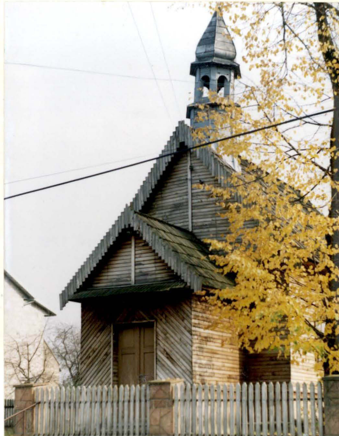
Widok od zach.