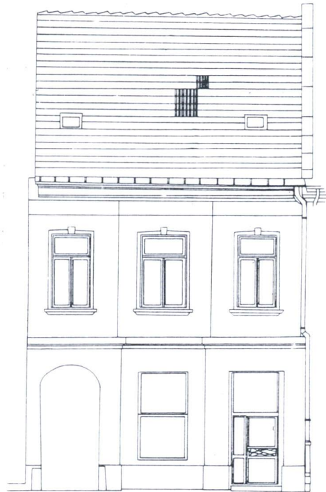
Rynek 10. Fotogrametria z 1980 r.