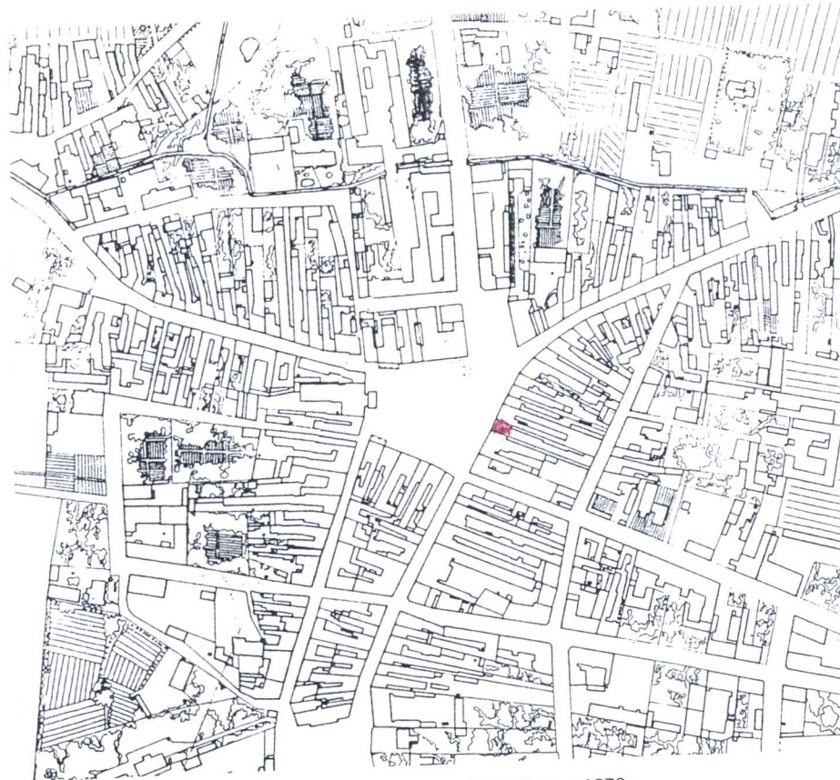
II. 41. Miasto lokacyjne na pomiarze Kielc z 1872 r.