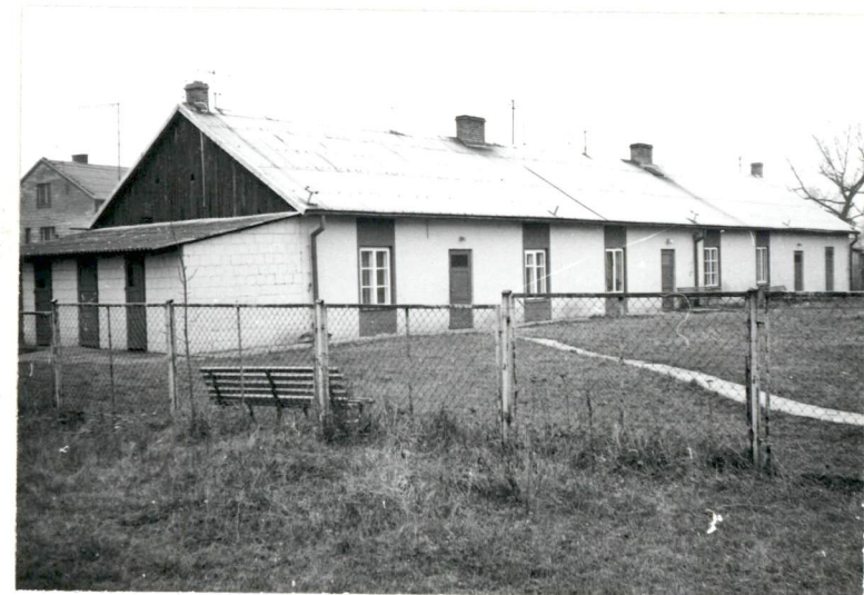
Widok na budynek pofol- warczy →

Wkładkę założył: Olgierd Chojnacki - 11.1991. (imię, nazwisko, data)