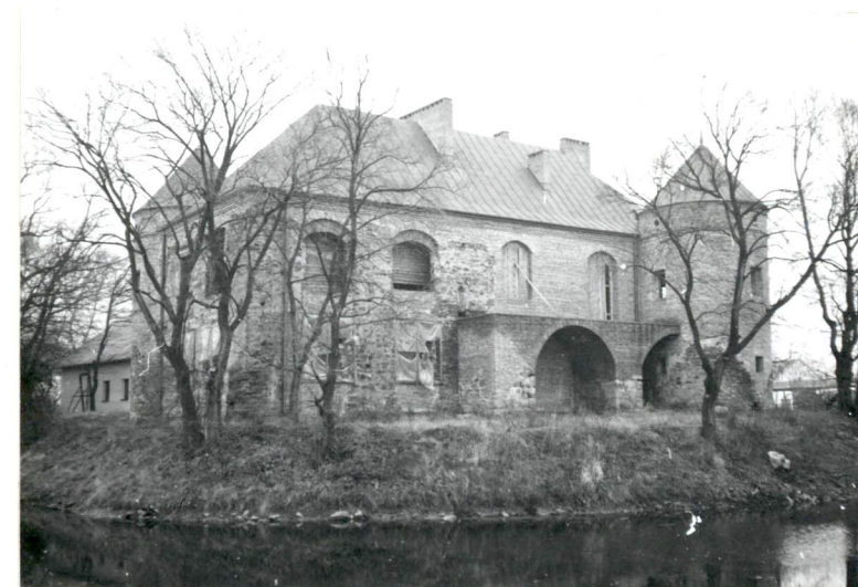
Widok od strony pd.-zach. →