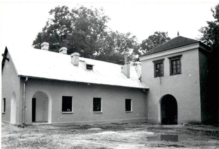
← Widok na budynek bramny i dawną kuźnię