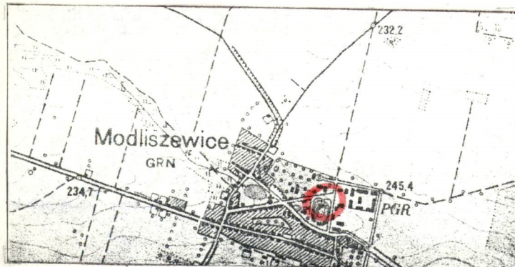
Plan orientacyjny zespołu - skala 1:50000 stan z 1964 r.

10. Rejestr zabytków Nr 1035 data 16.05.1984. 302 zabudowa 15.02.1964 213' dawna 2.10.1956