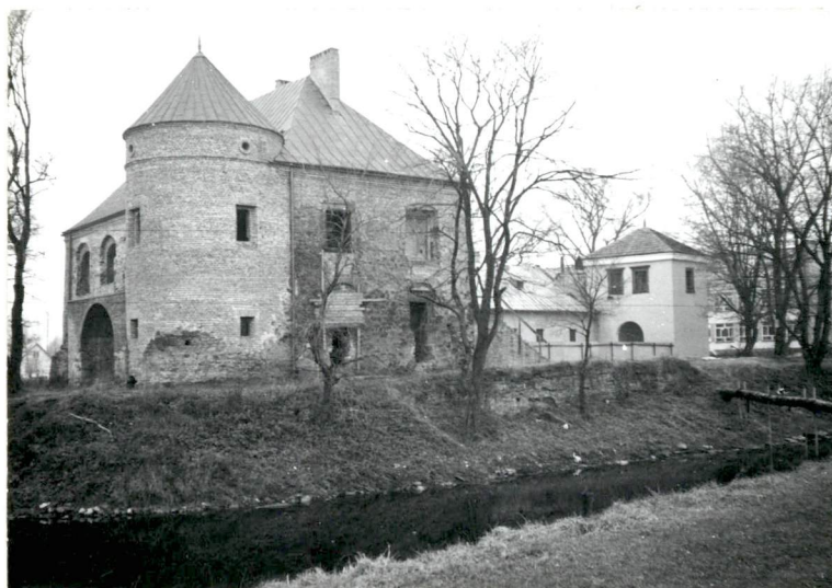
← Widok od strony pd.-wsch.