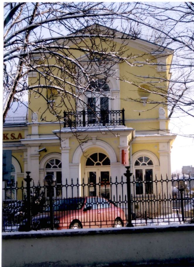
Fragment elewacji zachodniej