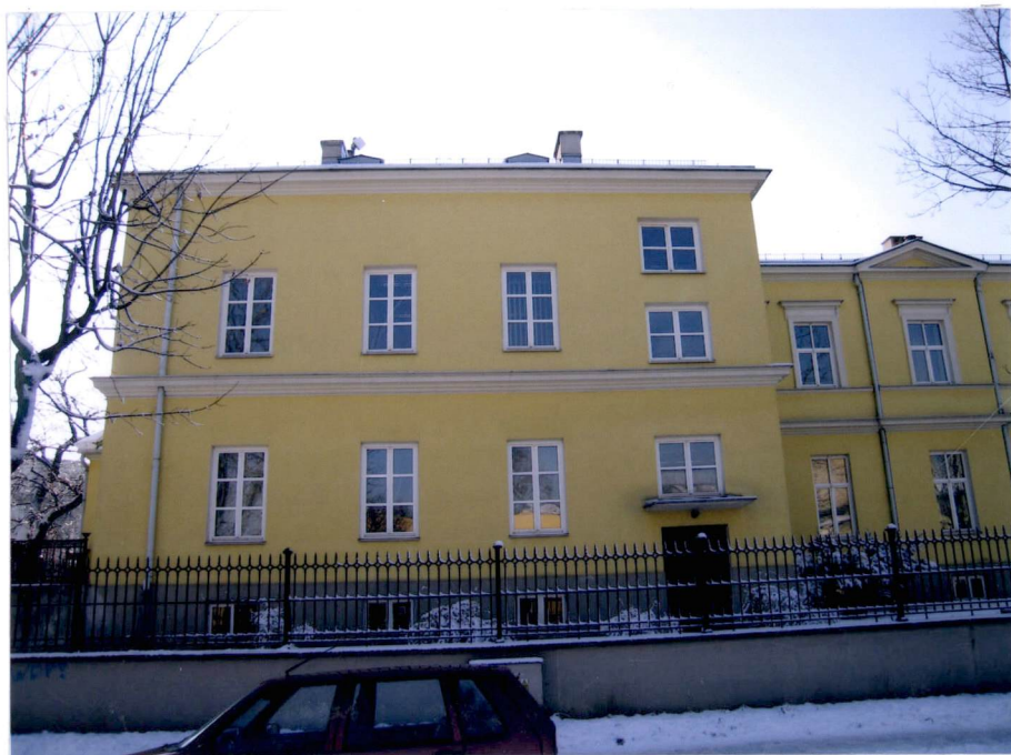
Fragment elewacji północnej