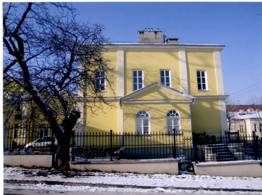
Fragment elewacji wschodniej