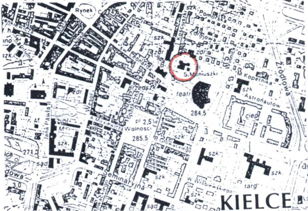
Plan orientacyjny. Lokalizacja obiektu w czerwonym koleczku