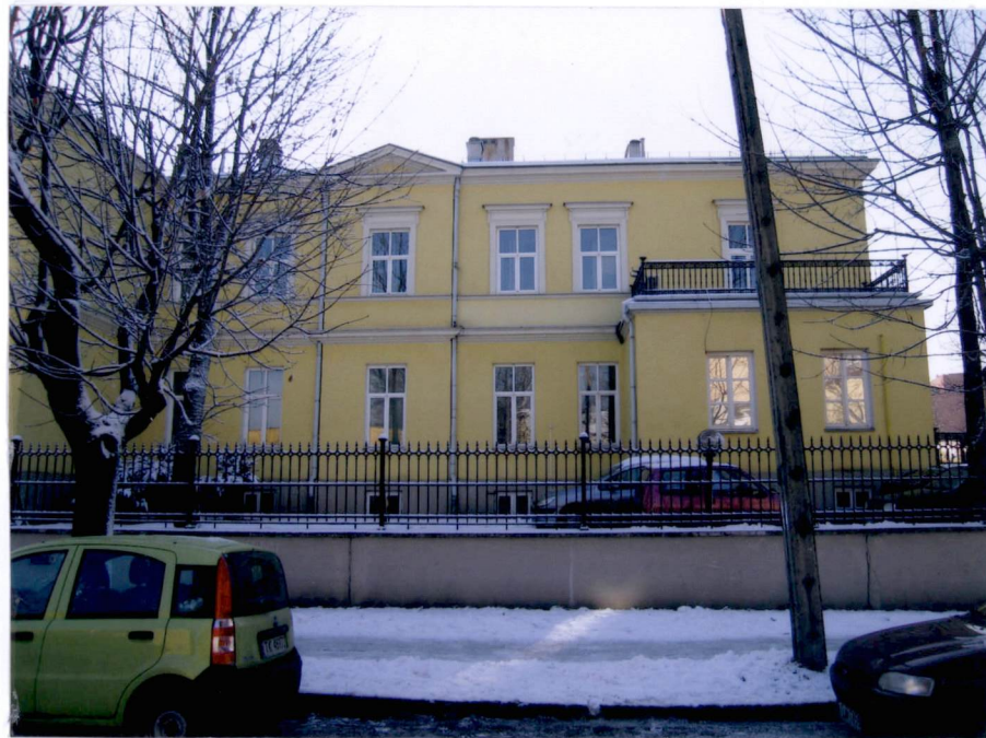
Fragment elewacji północnej