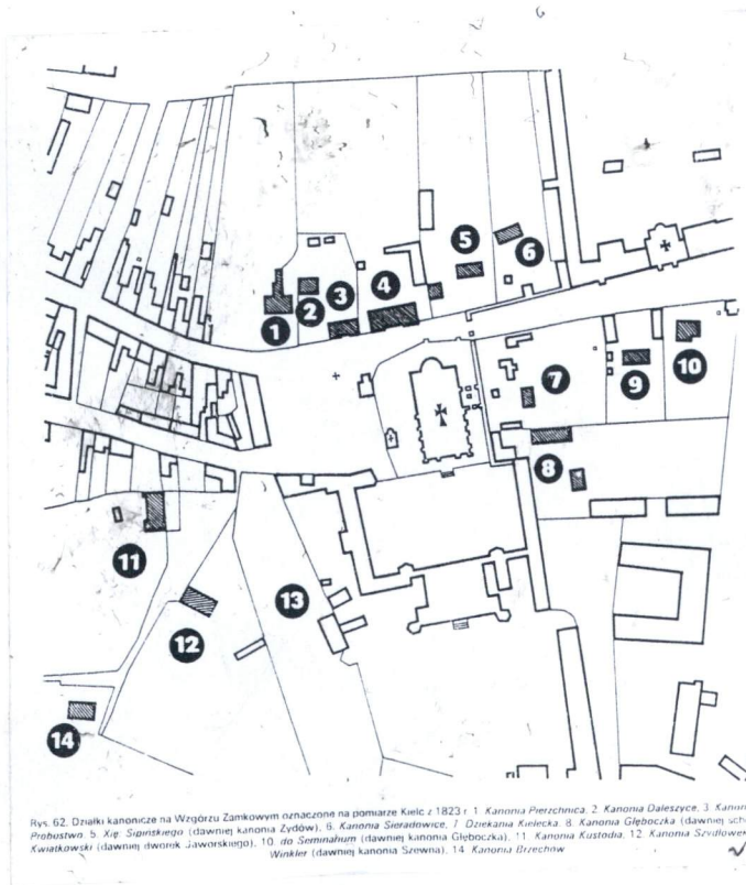
Rys. 62. Działki kanonice na Wzgórzu Zamkowym oznaczone na pomiarze Kielce z 1823 r. 1. Kanonia Pierzchnica, 2. Kanonia Dalezzyce, 3. Kanonia Probstwa, 5. Xp. Sigmund (dawniej kanonia Zydlow), 6. Kanonia Sieradziwa, 7. Dorszyna Kielce, 8. Kanonia Głębocza (dawniej uchi Kwiatkowski (dawniej ilwonek Jaworskiego), 10. do Somnialum (dawniej kanonia Głębocza), 11. Kanonia Kustodia, 12. Kanonia Szwidlowa, 13. Winkler (dawniej kanonia Szwidlowa), 14. Kanonia Brzechna