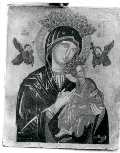
4. Obraz MB. z wnętrza.