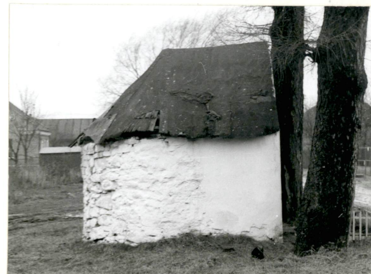
5. Elewacja pd.