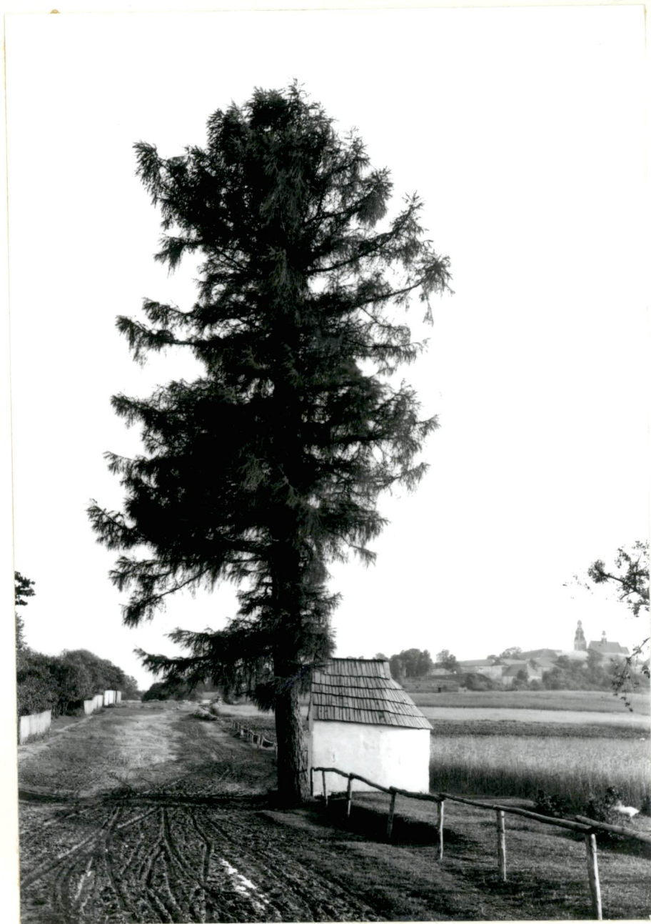
6. Fotografia kapliczki z 1925 r.