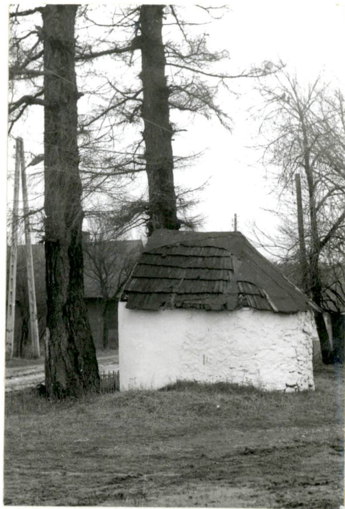
1. Widok od pn.