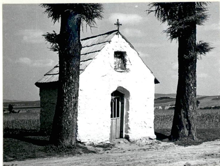
7. Fotografia kapliczki z 1952 r.