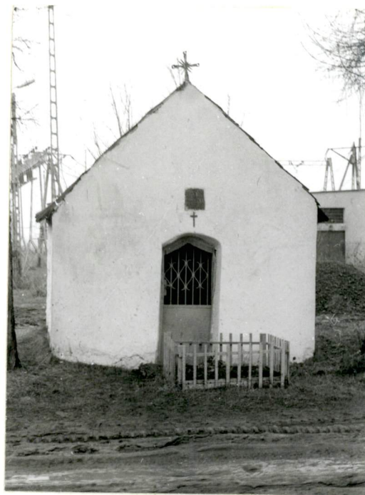
2. Elewacja frontowa.