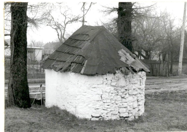
3. Widok od pn-zach.