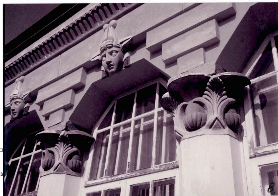
Końskie - zespół pałacowo-parkowy